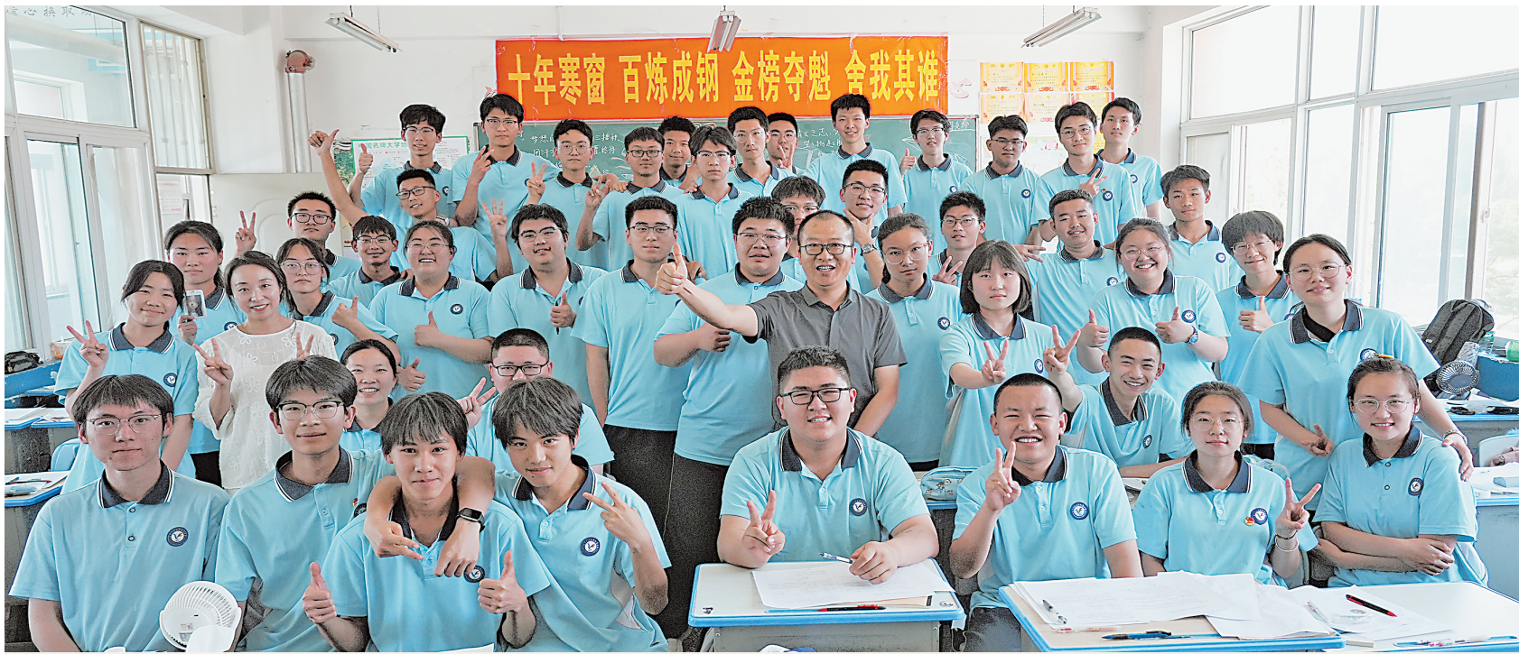
北方民族大学附属中学高三小A班学生与老师合影留念。