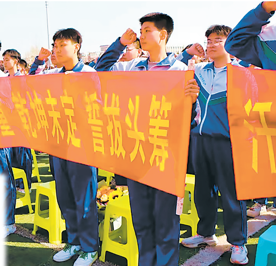
北方民族大学附属中学高考百日誓师大会青春助威。

保证充足的优质蛋白质类食物的摄入。如每日1个鸡蛋、250ml的牛奶、1小杯酸奶、鱼虾和畜禽肉2至3两,豆腐干1两或老豆腐1.5两,有助于维持大脑神经细胞的兴奋性和记忆功能。