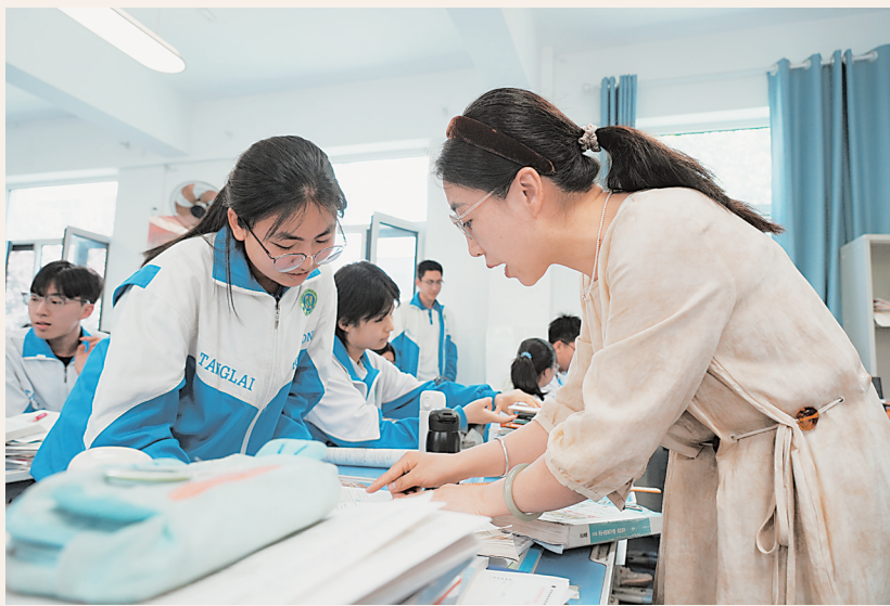
银川市唐徕中学老师耐心解答学生课后提出的问题。