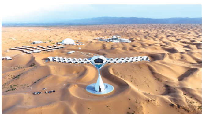
沙坡头旅游景区作为“中国沙漠旅游第一品牌”,持续推出沙漠星级酒店、钻石酒店、沙漠传奇等旅游度假产品,持续保持市场热度。