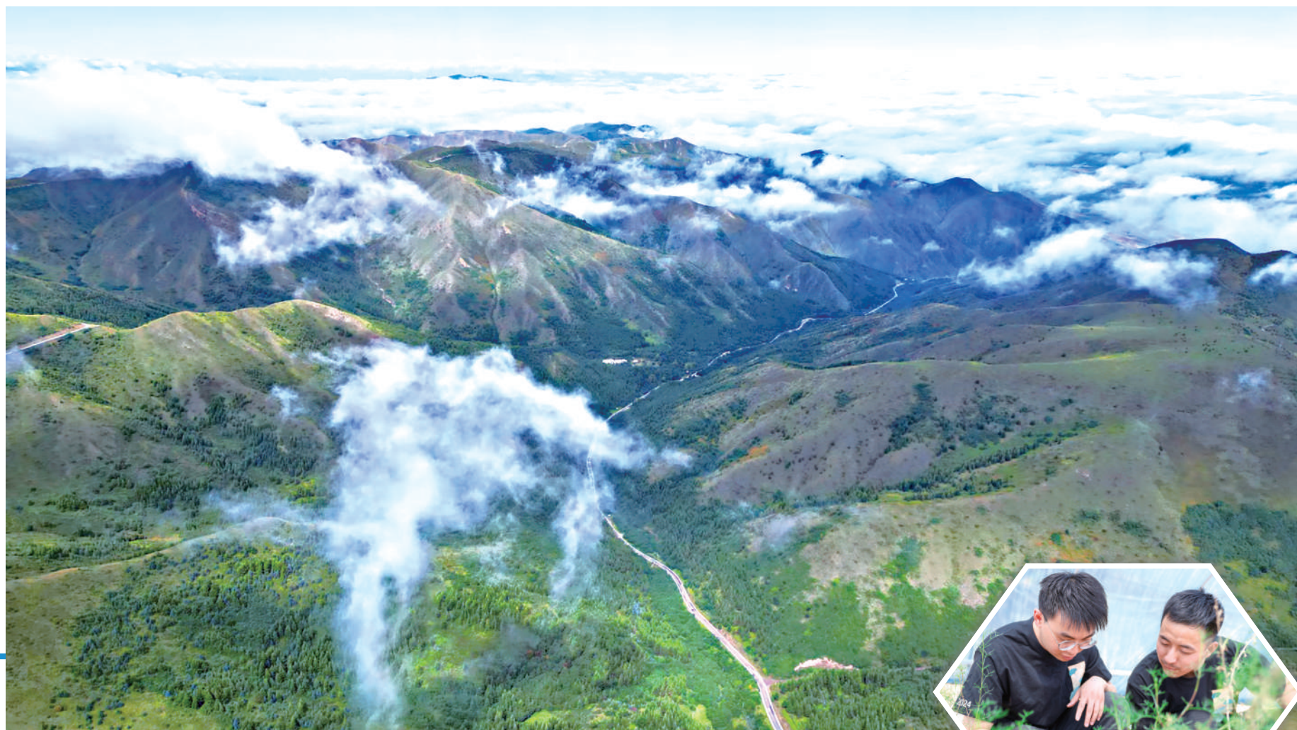
云雾笼罩的南华山像一幅山水画。