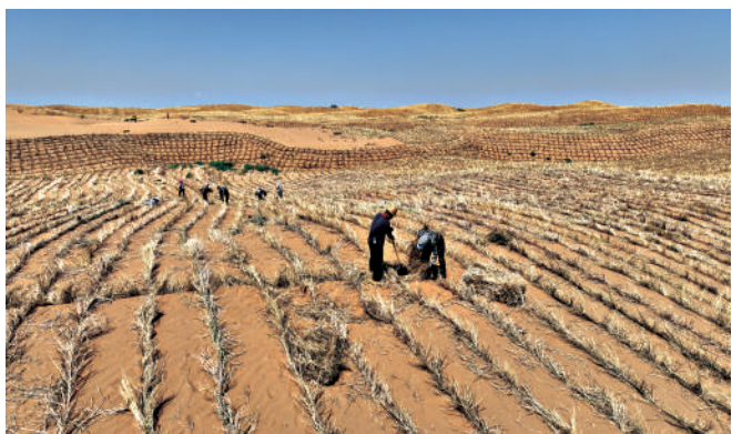
腾格里沙漠锁边工程现场,工人们扎制草方格。

2023年6月6日,在内蒙古巴彦淖尔市召开的加强荒漠化综合防治和推进“三北”等重点生态工程建设座谈会提出,加强荒漠化综合防治,深入推进“三北”等重点生态工程建设,事关我国生态安全、事关强国建设、事关中华民族永续发展,是一项功在当代、利在千秋的崇高事业。作为全境列入“三北”工程六期与黄河“几字弯”攻坚战的省区,宁夏以6.64万平方公里国土构筑起黄河流域生态保护的防线,承担着阻击沙漠合围、护卫华北生态安全的战略使命。近年来,宁夏树牢绿水青山就是金山银山理念,坚持精耕细作、久久为功,坚决打好黄河“几字弯”攻坚战,持续增厚“绿色家底”,为推动黄河流域生态保护和高质量发展先行区建设贡献力量。