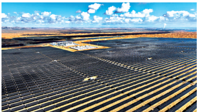
国家能源集团宁夏腾格里沙漠新能源基地,220余万块光伏板在阳光下熠熠生辉,仿佛一片蓝色的海洋。