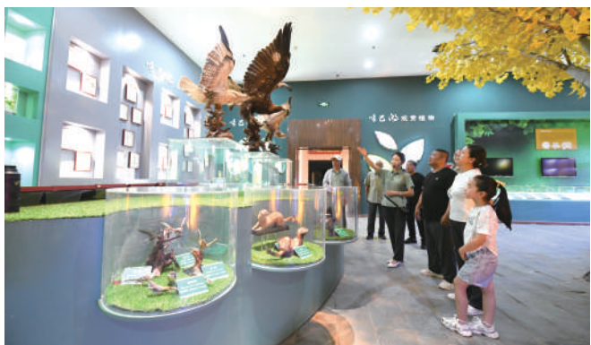
游客在盐池县哈巴湖科研宣教中心参观,了解防治沙漠生态改善成果。