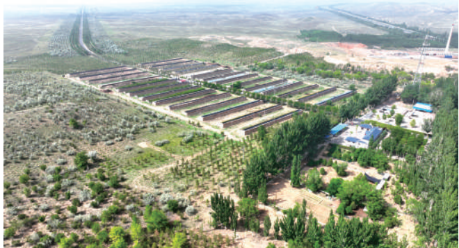
灵武白芨滩国家级自然保护区管理局甜水河管理站在保护区建起26栋暖棚,通过发展多种经营带动职工增收的同时反哺治沙。