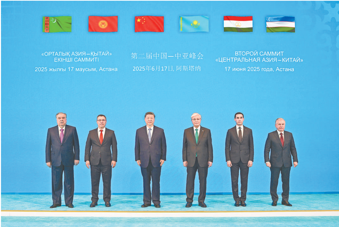
当地时间6月17日下午,第二届中国—中亚峰会在阿斯塔纳独立宫举行。哈萨克斯坦总统托卡耶夫主持会议。中国国家主席习近平、吉尔吉斯斯坦总统扎帕罗夫、塔吉克斯坦总统拉赫蒙、土库曼斯坦总统别尔德穆哈梅多夫、乌兹别克斯坦总统米尔济约耶夫出席。这是习近平同中亚五国元首集体合影。

新华社阿斯塔纳6月17日电 当地时间6月17日下午,第二届中国—中亚峰会在阿斯塔纳独立宫举行。哈萨克斯坦总统托卡耶夫主持会议。中国国家主席习近平、吉尔吉斯斯坦总统扎帕罗夫、塔吉克斯坦总统拉赫蒙、土库曼斯坦总统别尔德穆哈梅多夫、乌兹别克斯坦总统米尔济约耶夫出席。元首们在友好气氛中共同回顾西安峰会以来中国—中亚各领域合作成果,展望未来发展方向,一致决定弘扬“中国—中亚精神”,坚持永久睦邻友好,携手推动中国—中亚命运共同体建设不断取得新成就。 习近平同中亚五国元首集体合影,随后出席峰会,发表题为《弘扬“中国—中亚精神” 推动地区合作高质量发展》的主旨发言。 习近平指出,两年前,我们相聚中国西安,共同擘画了中国