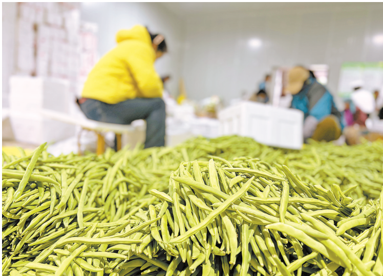
宁夏锦瑞合源电子商务有限公司的冷链包装车间里，工人在挑拣豆角。