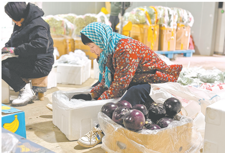
冷链包装车间里，工人将出口迪拜的茄子装箱。