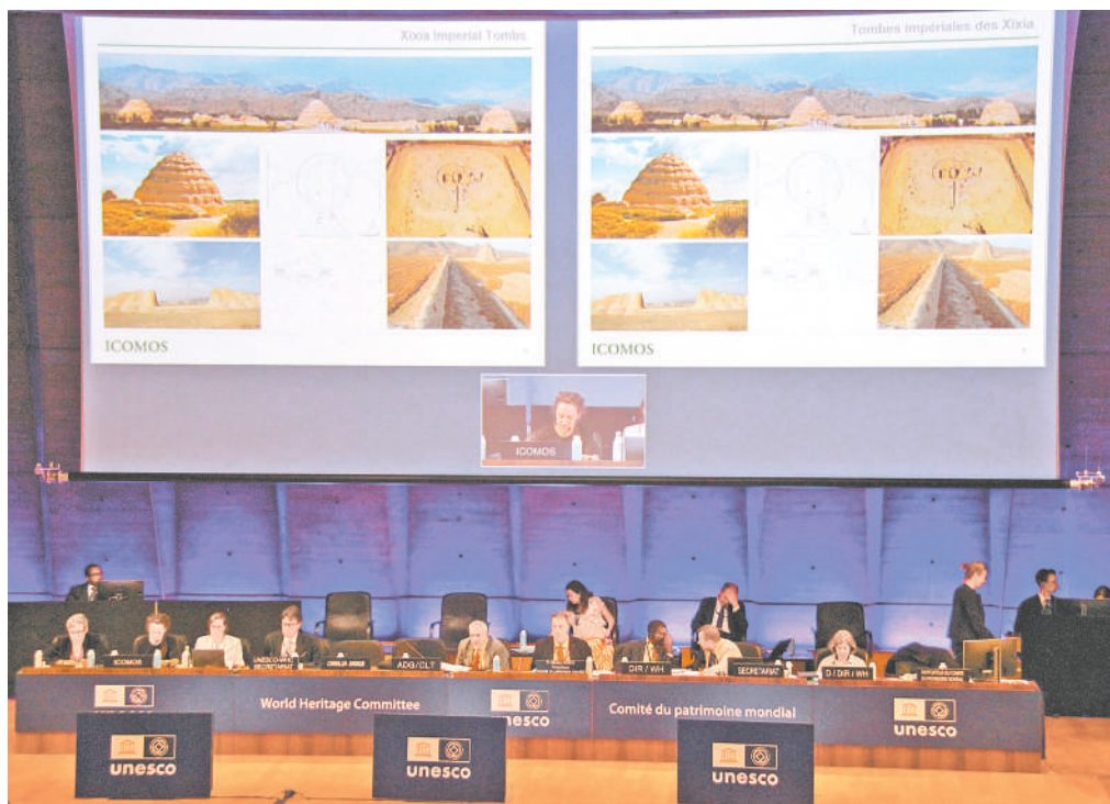
7月11日,在法国巴黎召开的联合国教科文组织第47届世界遗产大会介绍“西夏陵”遗址群保存情况。当地时间2025年7月11日,在法国巴黎召开的联合国教科文组织第47届世界遗产大会通过决议,将“西夏陵”列入《世界遗产名录》。