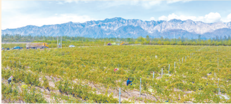
昔日的戈壁滩， 变为酿酒葡萄种植 基地。