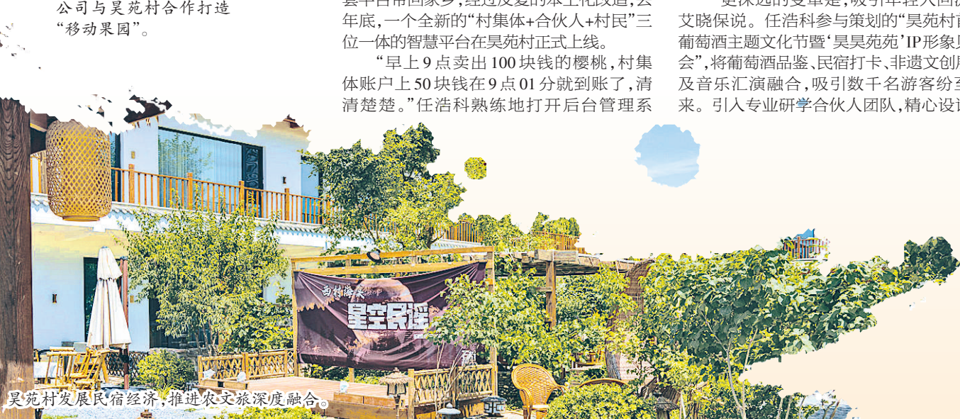
昊苑村发展民宿经济，推进农文旅深度融合。