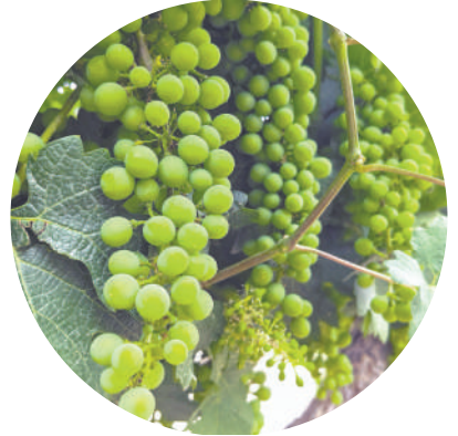
酿酒葡萄寄托着村民 的希望。