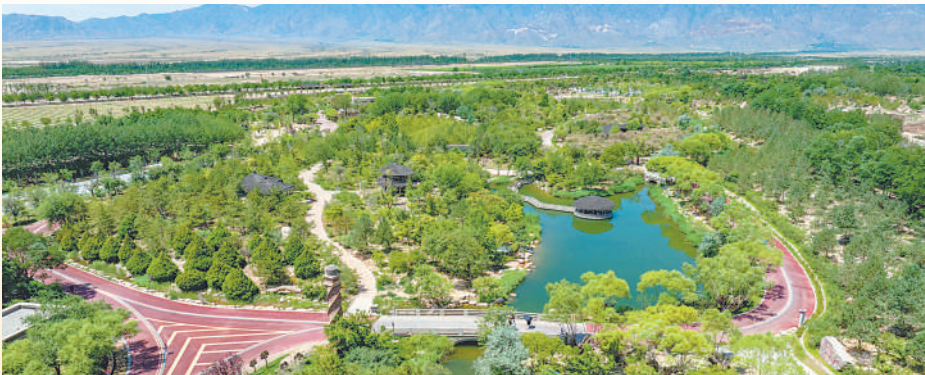
在矿坑上建成的贺兰山运动公园。

这些看得见、摸得着的变化，是政策支持与科技赋能的共同结晶，也是一代代实干者坚守初心、接续奋斗的生动写照。