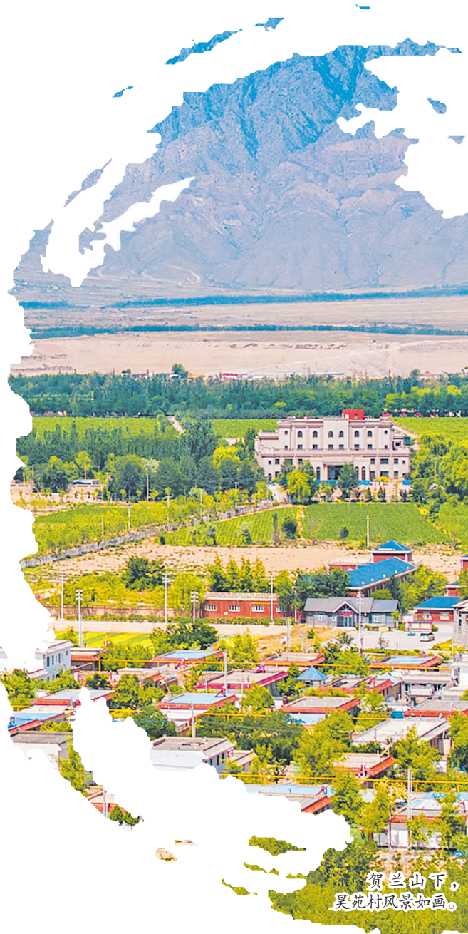
贺兰山下， 昊苑村风景如画。