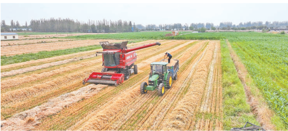
夏收期间,全区投入联合收割机2500余台,其中跨区作业超2000台。本报记者 李昊斌 摄

本报讯(记者 李昊斌)7月24日,记者从自治区农业农村厅获悉,截至7月22日,全区小麦收获面积达95.9万亩,收获进度达95.2%,剩余小麦主要集中在固原市原州区、隆德县,中卫