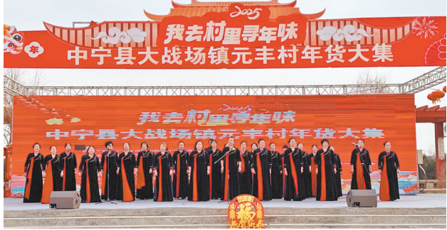
大战场农民合唱团演唱歌曲《金蛇狂舞》。