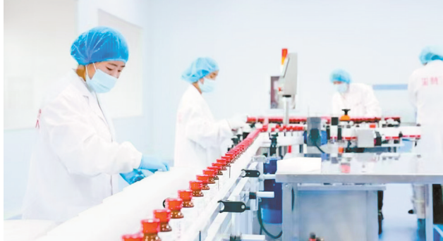
枸杞产业人才促进企业研发生产。