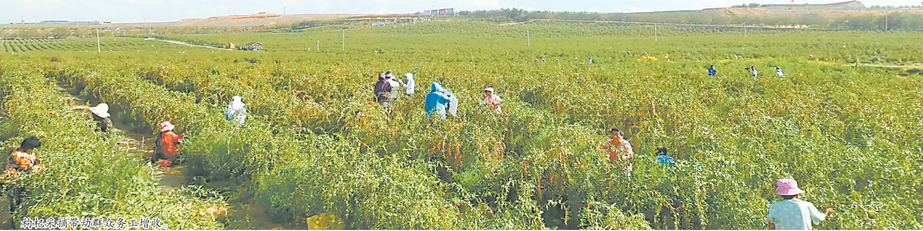
枸杞采摘带动群众务工增收。