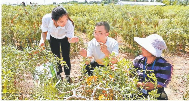
青年干部深入田间地头实践历练。