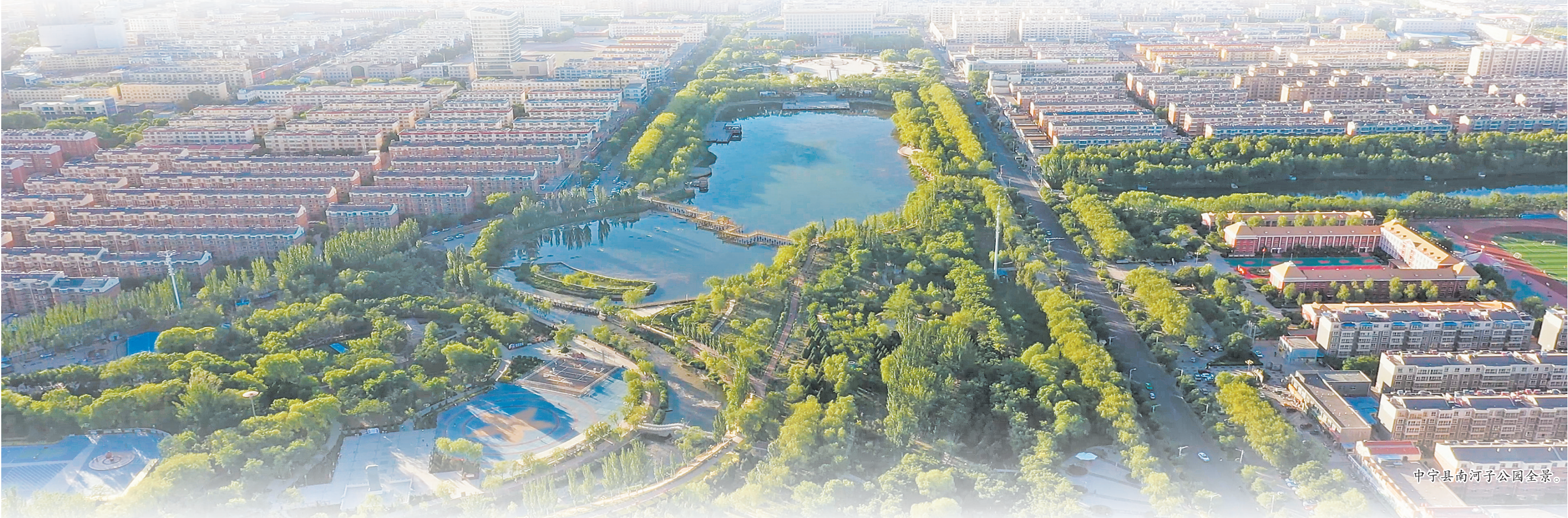
中宁县南河子公园全景。

“中宁枸杞”区域品牌价值突破205亿元,中宁县恩和镇沙滩村红色美丽村庄获评国家3A级旅游景区,中宁县审批服务管理局“支部建在窗口上”党建品牌在全国机关党建工作交流会上交流经验……一个个耀眼的成绩、一张张幸福的笑脸,展现了中宁县各族干部群众勠力同心共谋发展的累累硕果。 今年以来,中宁县全面落实新时代党的建设总要求和新时代党的组织路线,在服务大局中坚守政治方向,在聚焦主业中把握职责定位,在砥砺前行中积极担当作为,推动全县组织工作不断取得新进展新成效。