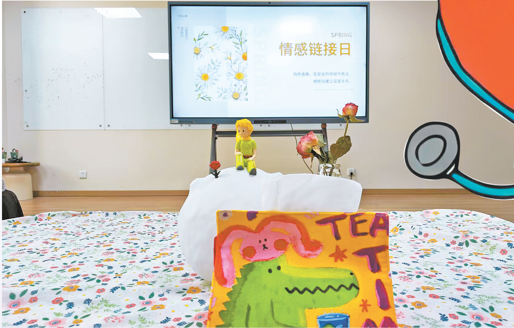
心理咨询环境很重要。

然而,繁荣背后却乱象丛生。心理咨询师的资质认证缺乏统一标准,培训体系良莠不齐,导致行业门槛模糊不清;虚假宣传手段泛滥,部分机构刻意夸大咨询效果,极易误导消费者。这些现象直接导致消费者易遭遇无效咨询、隐私泄露等问题,甚至被机构以制造焦虑等方式诱导高额消费,不仅未能缓解心理压力,反而遭受二次伤害,这既严重损害了消费者权益,也极大地削弱了心理咨询行业的公信力。