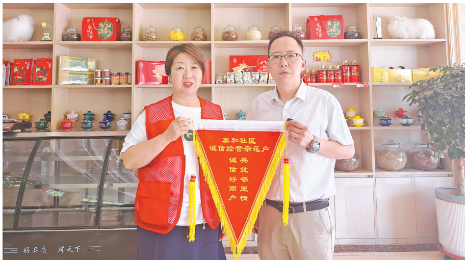
泰和社区为永禄民族饭庄颁发锦旗。