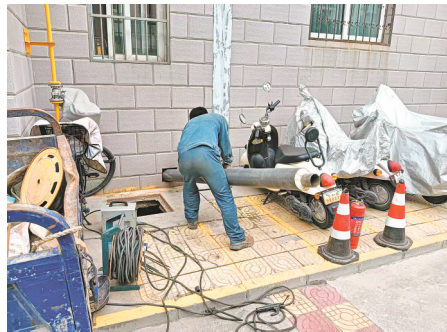
供热企业对正丰花园小区进行供暖改造。

供暖改造关乎居民冬季生活质量,也是破解老旧小区民生难题的重要举措。后续,记者将持续关注正丰花园小区供暖改造的推进情况,推动小区居民早日实现“暖冬”心愿。