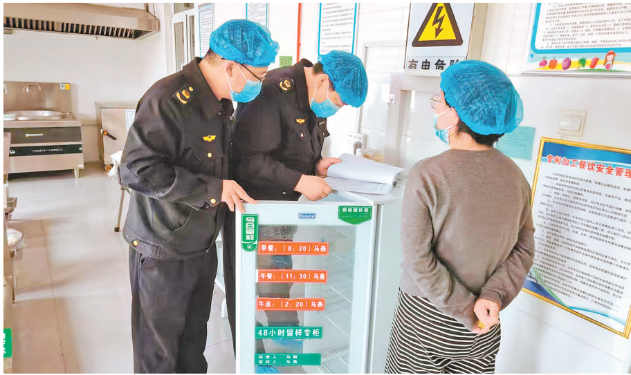
同心县市场监管局执法人员现场指导商家严格落实安全主体责任,完善台账记录与追溯机制,将信用监管融入日常管理,推动餐饮服务单位诚信、规范经营,保障消费者“舌尖上的安全”。

失信的影响很快反应到经营中,更让负责人犯难的是异地处理的陌生感,“处罚地在中卫市,我们人生地不熟,该联系哪个部门?流程怎么走?还需要准备什么材料?”一连串的疑问压在心头,让他辗转难眠,直到整理文件时,才发现与《行政处罚决定书》一同送来的《信用修复告知书》,竟然是破解困境的“指南”。