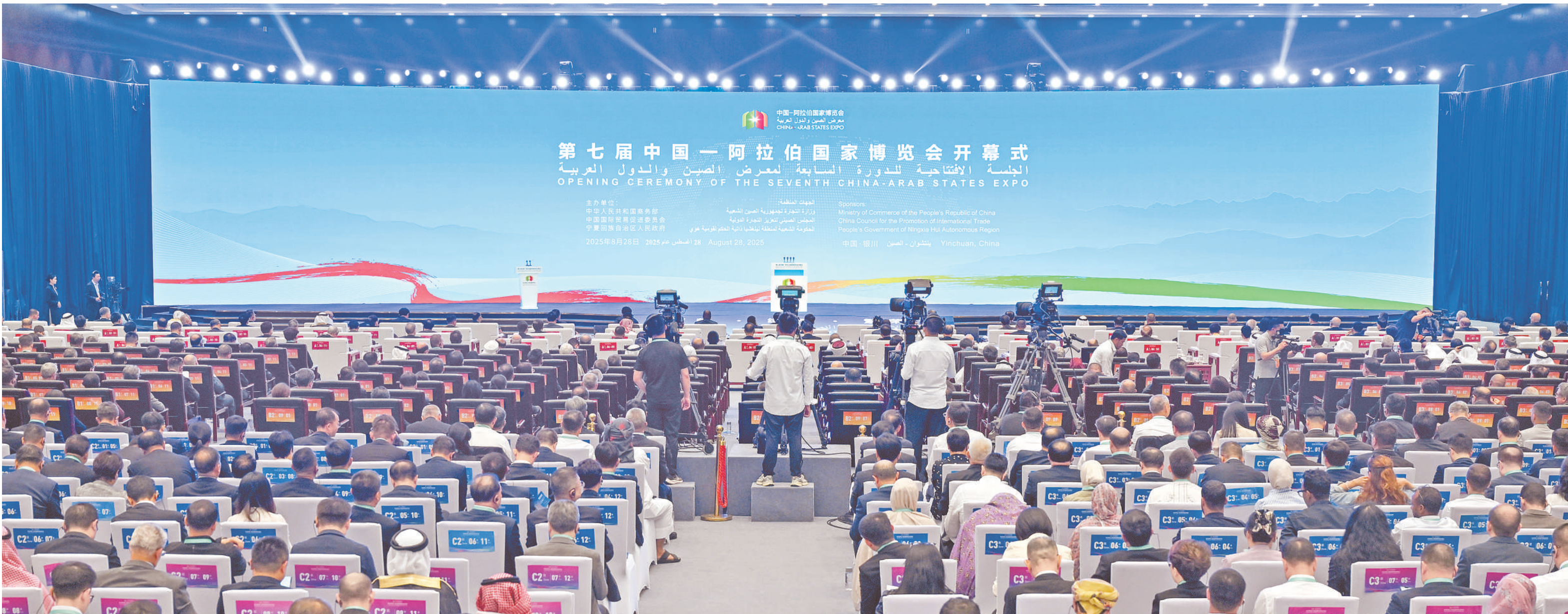
8月28日，第七届中国-阿拉伯国家博览会在银川开幕。

庄严、袁晓明、李兴乾等和外国政要进行了巡馆。 本届博览会由商务部、中国贸促会和自治区政府共同主办，以“创新、绿色、繁荣”为主题，举办开幕式和主宾国、主题省2项机制性活动，设置共建“一带一路”国家、区域经济合作等6大展区，组织开展中阿工商界经贸交流、技术转移与创新合作等8个板块40余项经贸交流活动，同期举办中阿“丝路电商”合作创新发展大会等活动，旨在深化中阿经贸、能源、科技、农业等传统合作，拓展人工智能、游戏产业、绿色低碳、智慧气象等新增长极。 自治区在职副省部级领导，来自75个国家和地区、17个国家部委及中央单位、31个省（区、市）及新疆生产建设兵团、港澳台地区的7600余位嘉宾，51位驻华使节、总领事、外交官，2200余家商协会和国内外企业代表、国内外新闻媒体记者参加博览会。