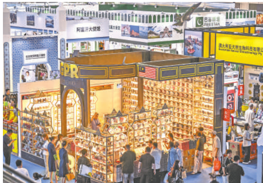
8月28日，观众在第七届中国-阿拉伯国家博览会参观。

命任务，指引宁夏与全国一道打赢了脱贫攻坚战，全面建成小康社会，同步踏上了中国式现代化建设的新征程。承重大使命，走开放之路、谱合作新篇，宁夏牢记习近平总书记殷切嘱托，守正创新、团结奋斗，开创经济繁荣新局面，续写民族团结进步新篇章，绘就环境优美新画卷、创造人民富裕新生活，一步一个脚印推进中国式现代化宁夏实践。 中阿博览会成为中阿深化经贸务实合作、共建“一带一路”的重要平台，为交流合作搭建了桥梁、创造了条件，有力促进了中国与阿拉伯国家的经贸合作向更大范围、更广领域、更深层推进。 大道不孤，众行致远。自2013年以来，前6届中阿博览会共有7500多家国内外企业参会参展，达成众多合作项目，涉及现代农业、高新技术、能源化工、生物制药、装备制造、基础设施、旅游合作等多个领域。本届中阿博览会的主题聚焦“创新、绿色、繁荣”，顺应了中阿合作的发展趋势和中阿人民的共同愿望。 （下转第二版）