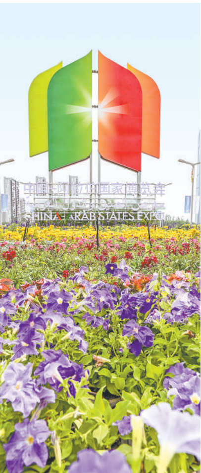
第七届中国-阿拉伯国家博览会开幕式会场外景。