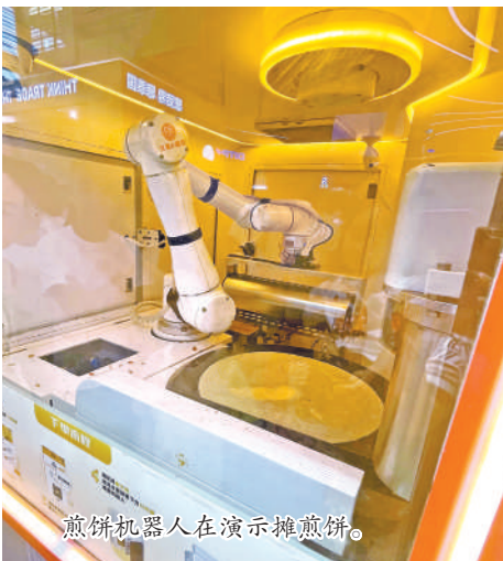
煎饼机器人在演示摊煎饼。

8月29日,第七届中国阿博览会举办的第二天,银川国际会展中心人山人海。现场,久秉机器人(北京)有限公司带来的煎饼机器人成了大“网红”。从9点开始,煎饼机器人吸引了众多参观者的目光。一位来自迪拜的客人对煎饼果子机器人表现出浓厚兴趣,并表达了订购5台机器人的意向。