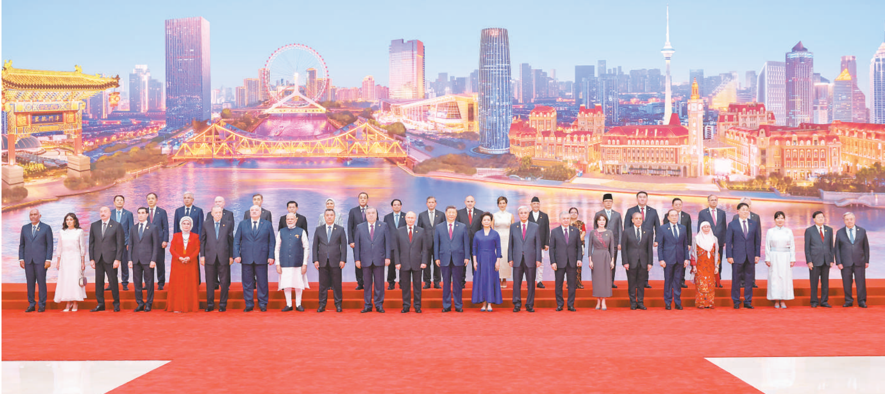
8月31日晚，国家主席习近平和夫人彭丽媛在天津梅江会展中心举行宴会，欢迎来华出席2025年上海合作组织峰会的国际贵宾。这是宴会前，习近平和彭丽媛同贵宾们集体合影留念。

新华社天津8月31日电 8月31日晚，国家主席习近平和夫人彭丽媛在天津梅江会展中心举行宴会，欢迎来华出席2025年上海合作组织峰会的国际贵宾。