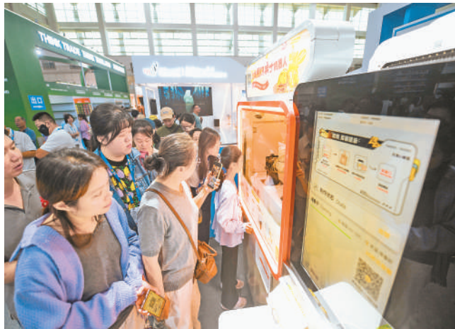
观众有序排队品尝机器人制作的煎饼果子。