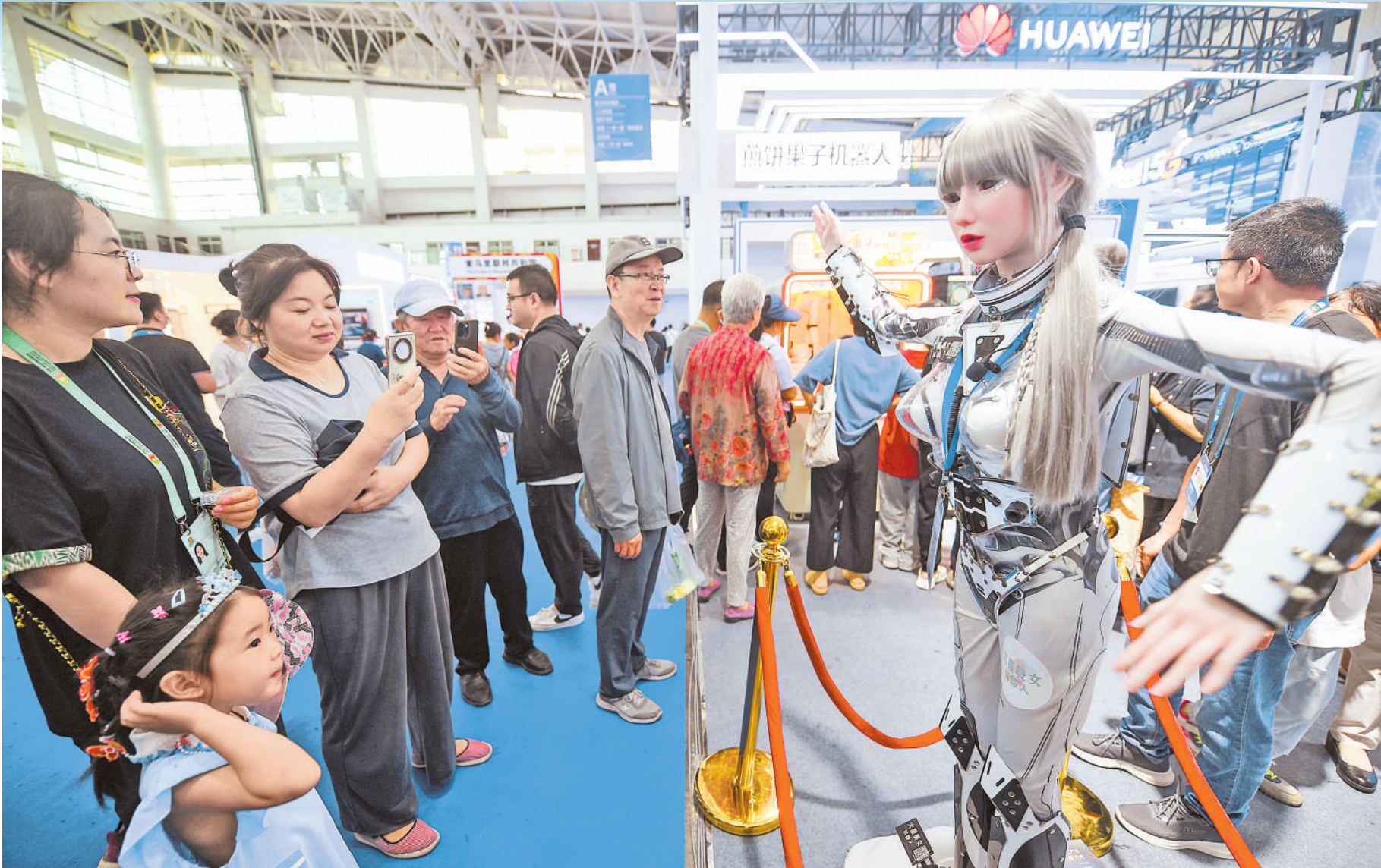
展会现场,伴着动感十足的乐曲,智能机器人跳起舞蹈。