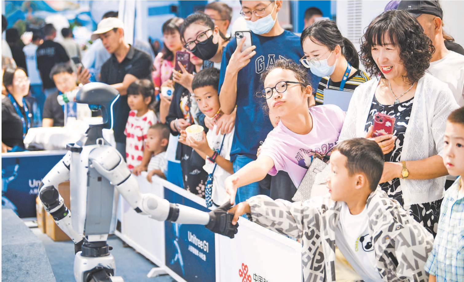
杭州宇树科技有限公司展位上,智能机器人G1与观众互动。