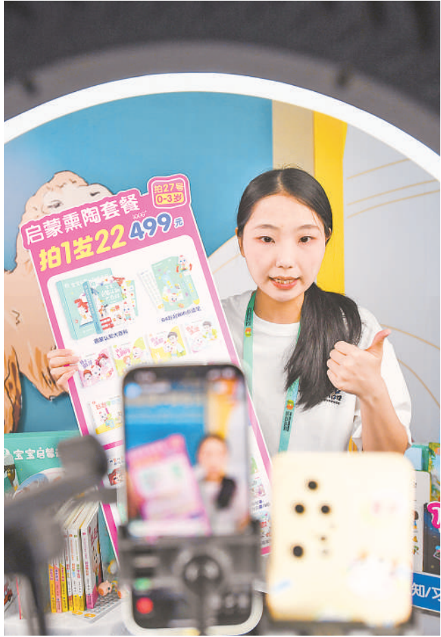
参展商现场架起直播设备,通过互联网销售商品。