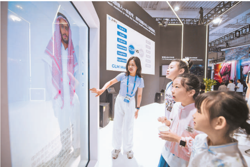
AI人机交互,体验感十足。