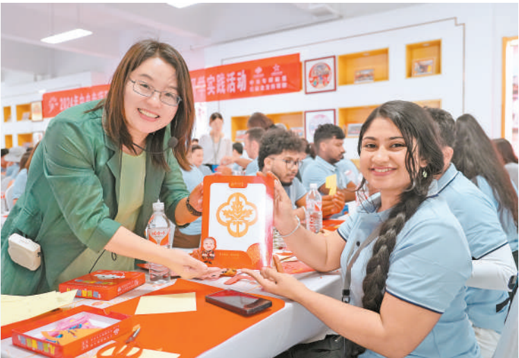
外国青年展示剪纸作品。

“其生有序,则万物兼济,其老有安,则天下太平。”高质量解决好养老问题,是每一个家庭都要面对的问题,也是不断满足人民日益增长的美好生活需要的题中应有之义。全区各地各部门在回答“养老”这个问题上,都要以积极答题的姿态、敢闯敢干的劲头,不断发现问题、解决问题,全力打造适应新时代需要的升级版养老服务,解决好养老这件民生大事。