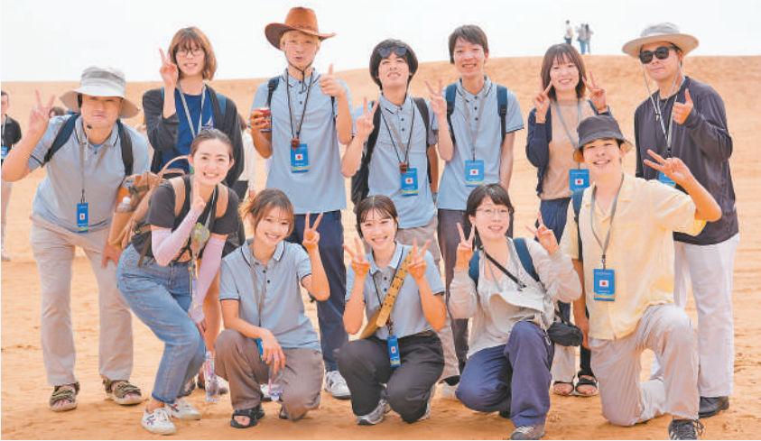
青年代表在沙坡头合影。

8月5日,以“青春同心 未来同行”为主题的2025宁夏国际青年友谊营在银川开幕。来自日本、韩国、格鲁吉亚、哈萨克斯坦等8个国家的61名青年代表与宁夏19名青年相聚塞上,开启一场跨越山海的文化探索与心灵对话。