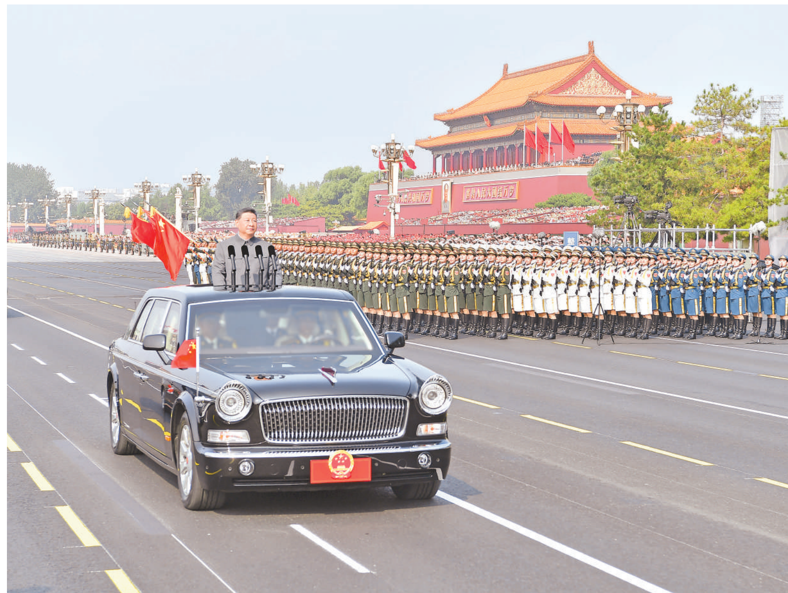
9月3日,纪念中国人民抗日战争暨世界反法西斯战争胜利80周年大会在北京天安门广场隆重举行。这是中共中央总书记、国家主席、中央军委主席习近平检阅受阅部队。