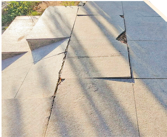
部分公园存在地砖边缘翘起情况。