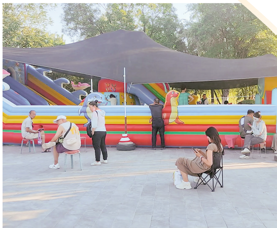
公园内游乐设备区域人流密集。