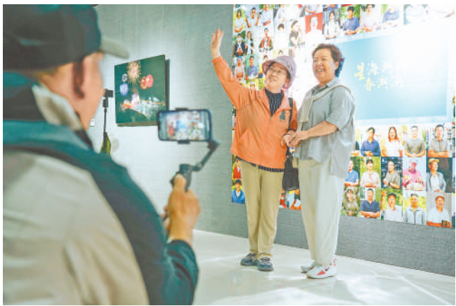
9月15日，在银川市美术馆，宁夏文联文艺创作扶持项目推出的“星海湖畔春潮涌”摄影作品展备受关注，以独特视角展现乡村振兴新貌，传递出温暖而磅礴的力量。据介绍，此次展览将持续至9月26日。

本报讯（记者 陶涛）9月11日，记者从自治区市场监督管理厅了解到，今年以来，该厅通过严格市场主体准入环节、强化设备安全监管、深化信用约束等举措，协同交通运输、公安等部门推进道路运输安全生产专项整治，全力保障全区道路运输安全。 在市场主体准入环节，我区市场监管部门对经营范围进行登记，并切实履行“双告知”职责，对办理相关经营范围的申请人，告知其在获审批前不得擅自从事经营活动。并通过国家企业信用信息公示系统——部门协同监管平台，将市场主体登记信息实时推送至同级交通运输部门。截至8月底，累计向交通运输部门推送数据1.2万余条。积极配合自治区交通运输厅推动开办货运企业“高效办成一件事”改革落地实施，实现企业营业执照信息核验与事项办理高效衔接。 在设备安全监管方面，完成高速公路141台治超称重设备和公安交警部门1542台测速仪的强制检定工作，组织全区77名机动车检验授权签字人参加能力测试。通过跨部门联合抽查，检查54家机构，督促整改问题96项，切实保障交通执法设备准确可靠。 截至目前，自治区市场监管厅共组织开展机动车配件、电动自行车及配件等12类产品151批次专项抽查，不合格发现率为2%；检查电动自行车销售门店519家，严厉打击非法改装和拼装行为。同时，通过国家企业信用信息公示系统(宁夏)公示市场监管部门电动自行车安全类处罚信息27件、外部门交通安全类处罚信息471件。全面排查车用气瓶充装、检验、使用等环节安全隐患，检查气瓶充装单位476家次、检验机构24家次，发现并督促整改问题隐患111个，查办案件26起，注销6家车用气瓶检验机构资质。