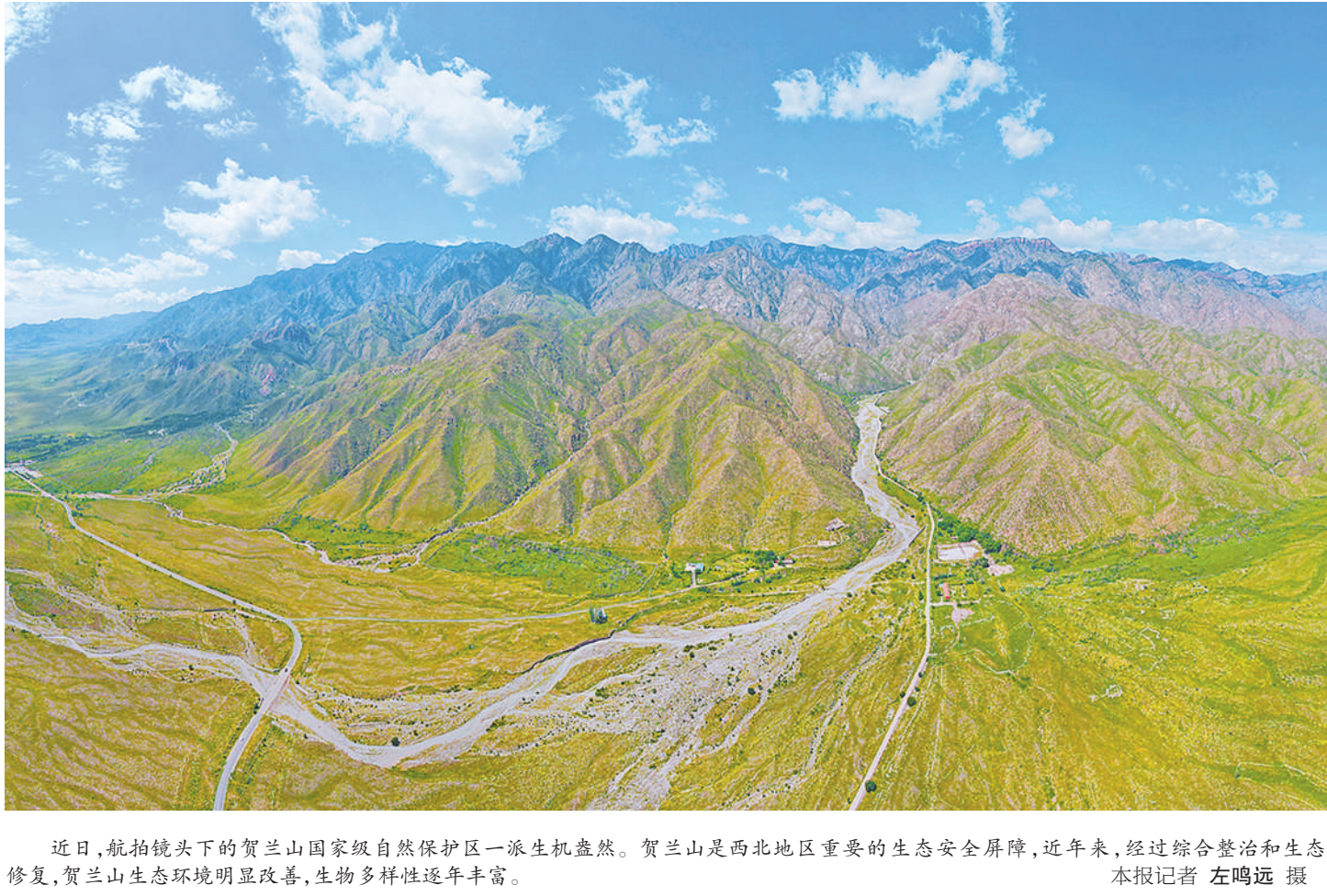
近日，航拍镜头下的贺兰山国家级自然保护区一派生机盎然。贺兰山是西北地区重要的生态安全屏障，近年来，经过综合整治和生态修复，贺兰山生态环境明显改善，生物多样性逐年丰富。

本报讯（记者 李昊斌 李宏亮）9月9日，走进银川市兴庆区数字经济产业园内，键盘敲击声与跨境订单的提示音此起彼伏，数百家电商企业在这里连接世界，昔日内陆地区如今正依托数字丝路走向开放前沿。 “您好，请问有什么可以帮您？”在中国（宁夏）国际贸易单一窗口客服中心——这处位于产业园内的服务机构，负责人牛子慧每天忙碌接听热线电话，电话那头则是宁夏各地外贸企业焦急的询问。 “我们平均每天处理近百个95198热线咨询电话，问题解决率保持在90%以上。”牛子慧告诉记者，“通过国际贸易单一窗口，可以有效缩减企业在进出口环节的时间和成本，目前单人窗口可以实现25个大类、923项