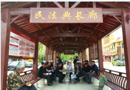
长廊下宣讲民法典。

“八五”普法期间,永宁县成绩斐然,法治观念深入人心,成为经济社会发展的有力保障。展望未来,永宁县将继续秉持创新精神,深化普法实践,推动普法工作再上新台阶,为建设更高水平的法治永宁、平安永宁而不懈努力,让法治之花在永宁大地绽放得更加绚烂。