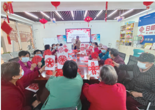
社区普法剪纸活动。