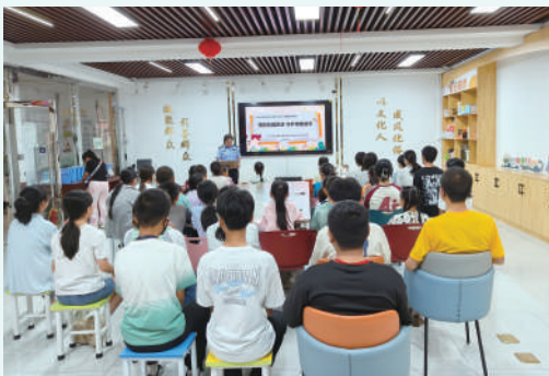
预防校园欺凌宣讲。