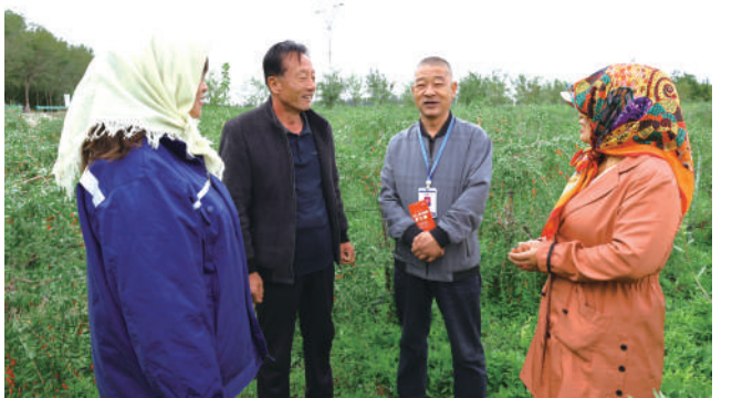
舟塔司法所所在枸杞地里调解矛盾纠纷。