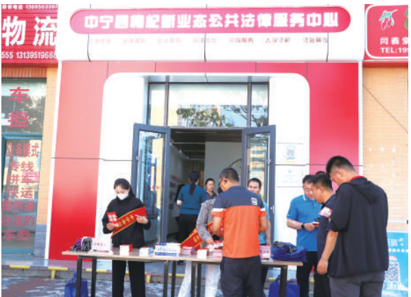
中宁县枸杞新业态公共法律服务中心开展普法宣传活动。