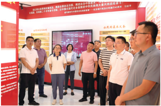
中宁县组织各部门工作人员参观宪法教育基地。

征程万里风正劲，重任千钧再出发。“八五”普法取得的丰硕成果为中宁县法治建设奠定了坚实基础。展望未来，中宁县将保持“闯”的精神、“创”的劲头、“干”的作风，在普法工作的广度、深度和精度上持续用力，不断健全完善全民普法工作体系，着力提升公民法治素养和社会治理法治化水平，努力使尊法学法守法用法在全社会蔚然成风，为奋力谱写中宁县高质量发展新篇章提供更加坚实的法治保障！