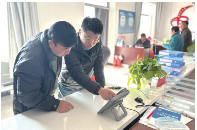
中宁县司法局工作人员引导群众遇事找“法”。