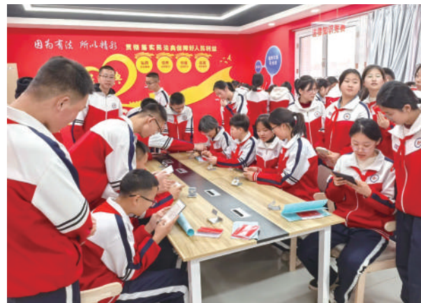
中宁县第六中学青少年法治教育基地开展普法活动。