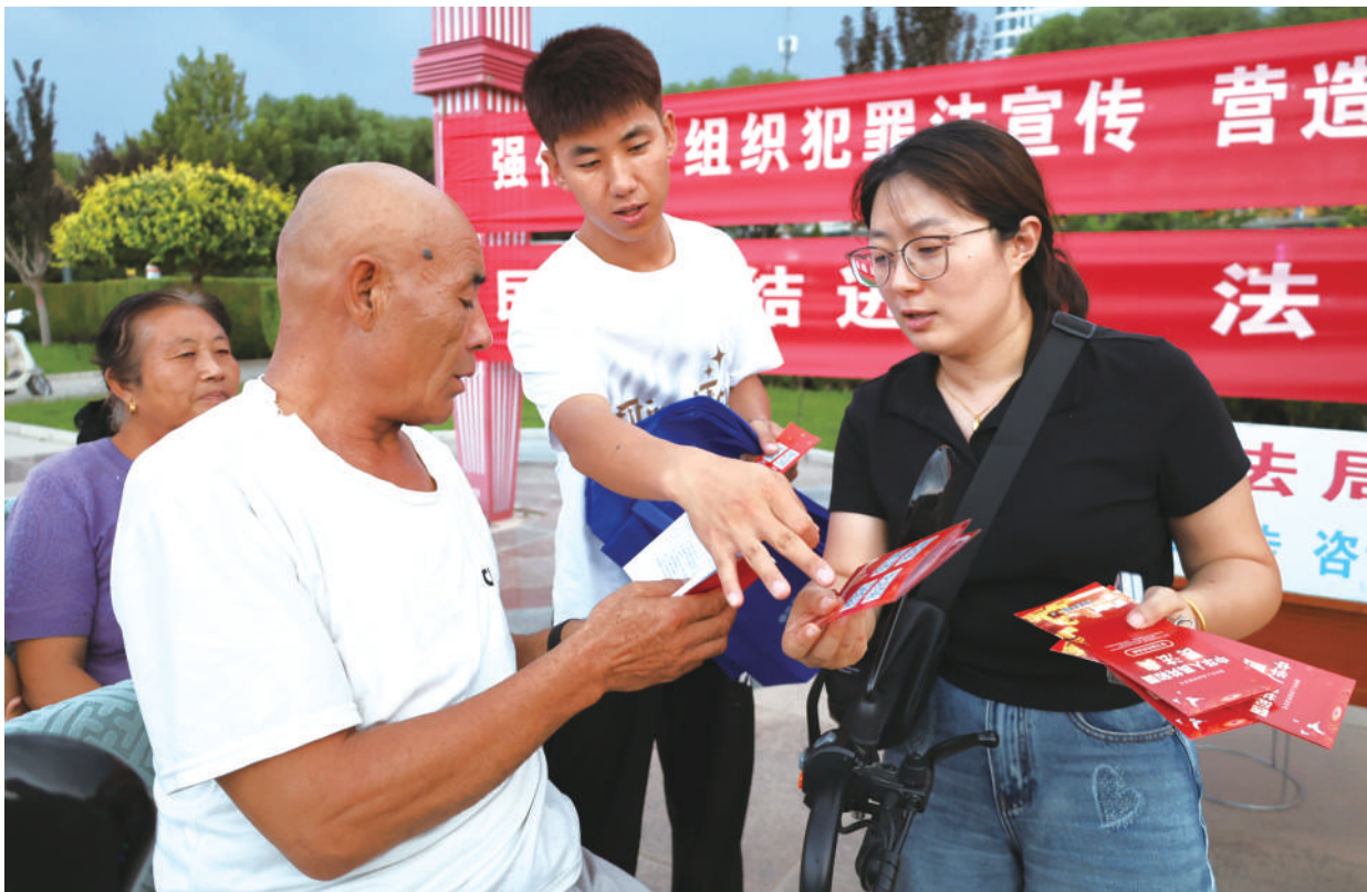
中宁县司法局在人民广场开展普法宣传活动。