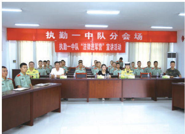
中宁县司法局联合中宁县公安局开展“法律进军营”活动。