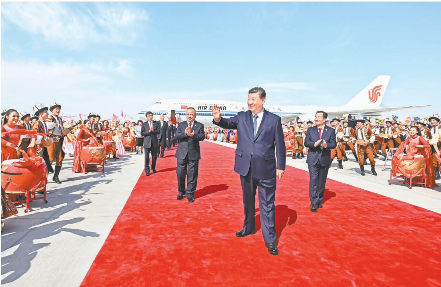
9月23日下午,中共中央总书记、国家主席、中央军委主席习近平率中央代表团乘专机抵达乌鲁木齐,出席新疆维吾尔自治区成立70周年庆祝活动。这是习近平向欢迎群众挥手致意。

担任中央代表团副团长的中共中央政治局委员、中央统战部副部长李干杰,全国人大常委会副委员长雪克来提·扎克尔,国务委员谌贻琴,全国政协副主席王东峰,中央军委委员刘振立,陪同出席活动的中共中央政治局委员、国务院副总理何立峰,中共中央书记处