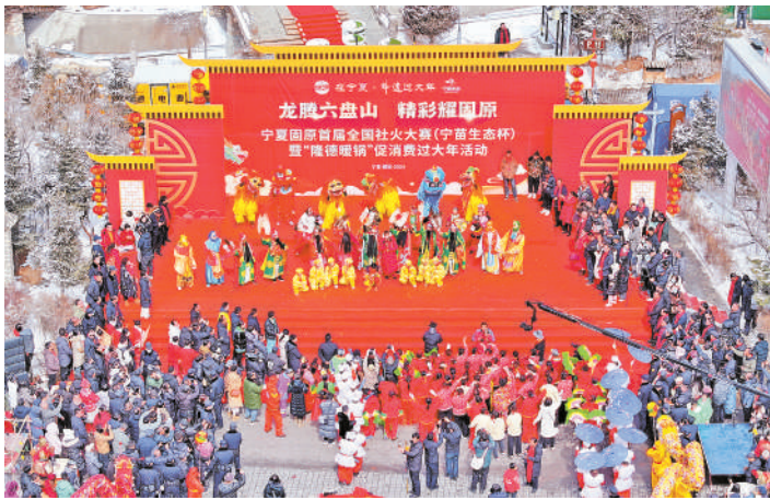
固原市首届全国社火大赛暨“隆德暖锅”促消费过大年活动现场。