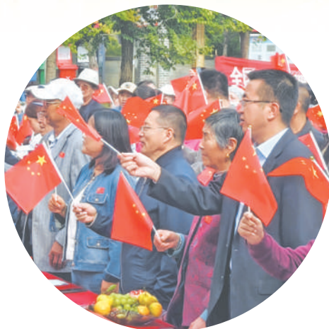
原州区雁岭社区举办“情暖侨心迎中秋 同心筑梦庆国庆”中秋联谊活动。

等“十笔账”,引发强烈共鸣,让各族干部群众真切感受到发展带来的获得感、幸福感。 在文化传承方面,固原市每年开展“戏曲进乡村”、广场文化活动等500余场,丰富基层群众文化生活。固原古城等历史遗址和固原博物馆馆藏的北周鎏金银壶、北魏漆棺画等珍贵文物,成为讲述中华民族多元一体融合故事的生动教材。杨氏泥塑、魏氏砖雕、隆德花灯等非遗代表性项目在创新中传承发展,共同构筑中华民族共有精神家园。 固原市还创新打造“五堂精品课”教育体系,将“行走的思政课”、“三交”历史体验课、红军长征主题课等融入干部教育和社会教育。固原市第二中学连续30年徒步108里祭奠英烈的活动,作为全国大思政课优秀案例,在青少年心中深植爱国主义情怀。 原州区、隆德县分别获得中国民间文化艺术之乡等称号,西吉县成为中国首个“文学之乡”,马金莲、马骏等少数民族作家,用笔墨书写着民族团结的动人故事。2018年以来,固原市两次召开民族团结进步表彰大会,选树模范集体和个人,充分发挥先进典型的示范引领作用,推动民族团结理念深入人心。