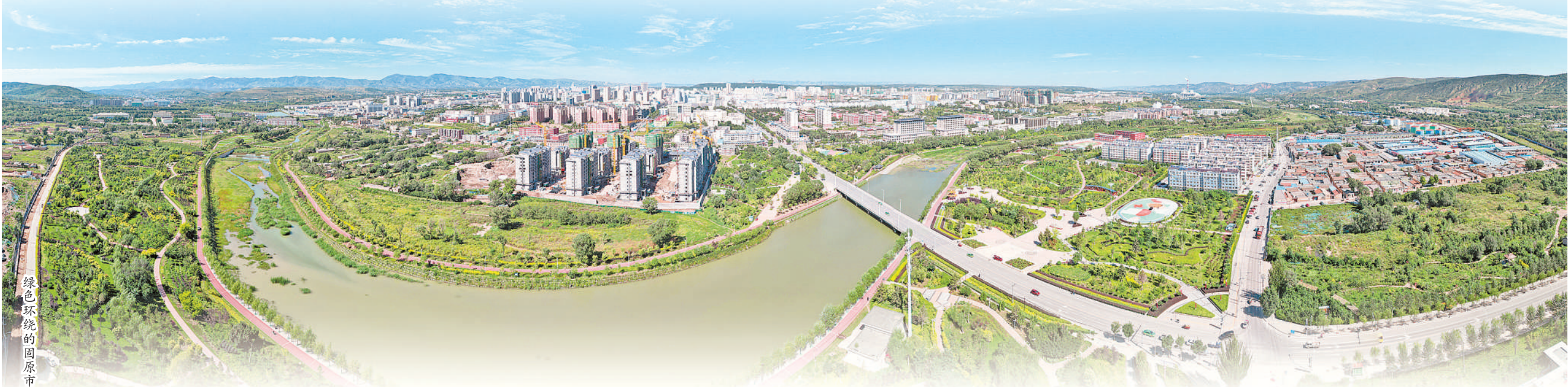
绿色环绕的固原市。