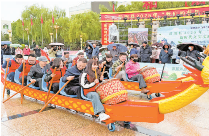
彭阳县茹河街社区举行端午节活动。