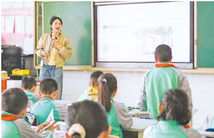
泾源县各族青少年“同唱一首歌、同上一堂课”。