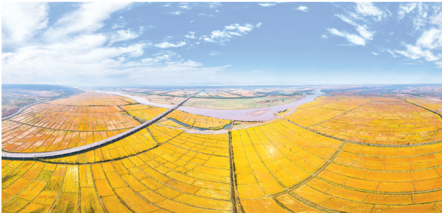
近日,俯瞰黄河银川段,金黄的稻浪组成一幅丰收的画卷。

资源“雕琢”成涵盖保健食品、特殊膳食等三大品类、百余种产品,培育出免疫健康、心脑血管健康等五大核心产品系列,打造了羊胎素专业化生产基地。 数智化的脚步仍在向前,发展的脚步并未停歇。在银川伊百盛生物工程有限公司厂区一侧,1号综合办公楼项目正拔地而起。该项目集3A级宁夏滩羊高端产业文化馆和研发中心于一体,预计今年11月即可装修完工并投入使用。 银川伊百盛生物工程有限公司的稳步发展,正是当下我区民营经济活力迸发、迈向高质量发展的生动缩影。