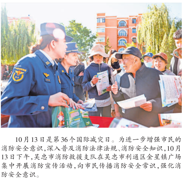
10月13日是第36个国际减灾日。为进一步增强市民的消防安全意识,深入普及消防法律法规、消防安全知识,10月13日下午,吴忠市消防救援支队在吴忠市利通区金星镇广场集中开展消防宣传活动,向市民传播消防安全常识,强化消防安全意识。