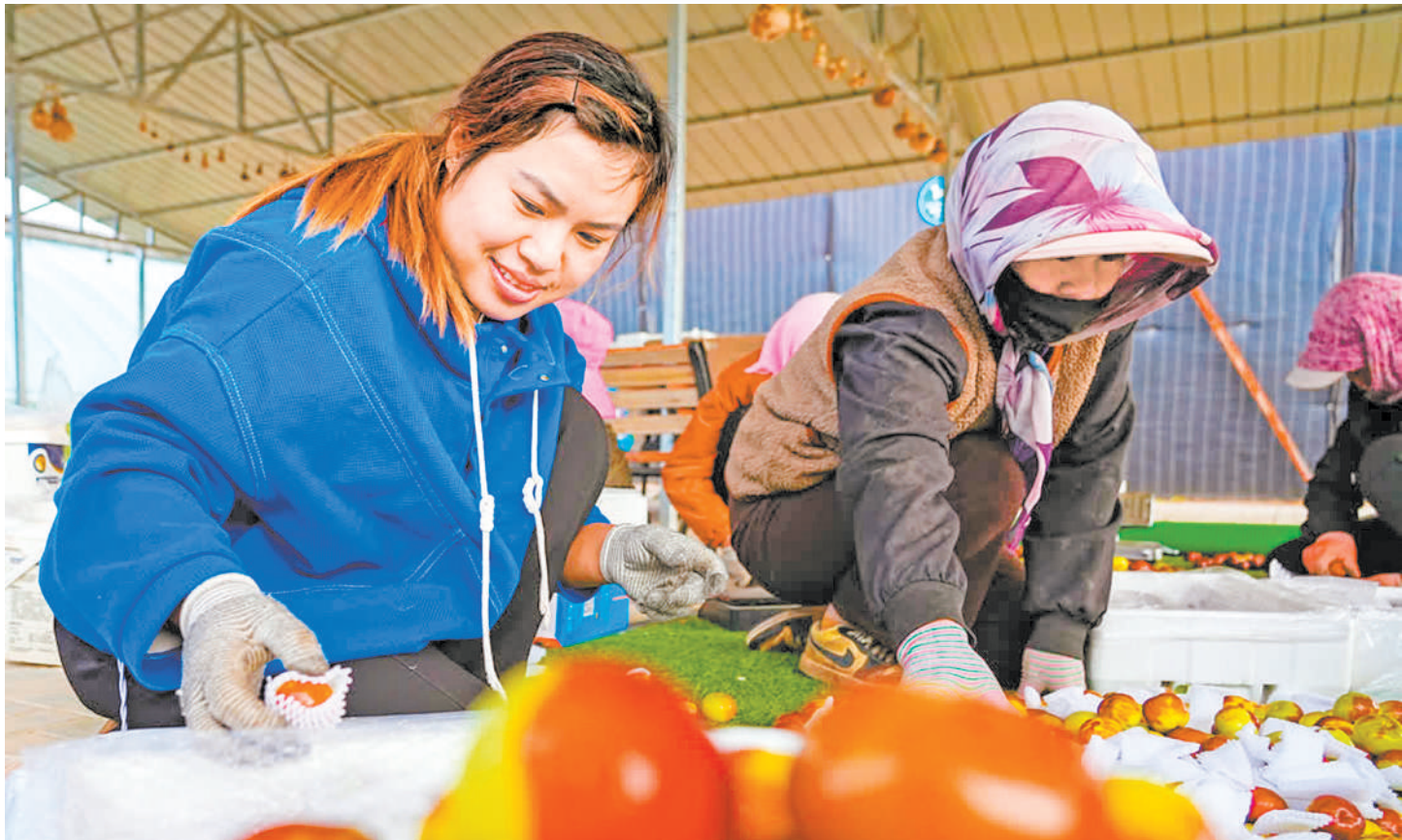
10月14日,村民在分拣蟠枣,这些蟠枣第二天将摆上河南胖东来超市的货架。

“每两三天就有一批蟠枣从银川发往河南胖东来超市,截至目前已累计发货超12000斤!”10月14日上午,银川市兴庆区月牙湖乡涌捷农林专业合作社的大棚前,务工村民们聚在一起,手里忙个不停。他们小心翼翼地为新采的蟠枣包上网套,整齐码入泡沫包装盒……一箱箱品相完美的蟠枣在打包装箱后,即坐上飞机“落户”河南胖东来超市。 “我们月牙湖乡的蟠枣糖度高、口感脆甜,果形饱满独特,很受消费者喜爱。”涌捷农