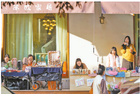
漫步于各个摊位之间,感受手作的独特魅力。