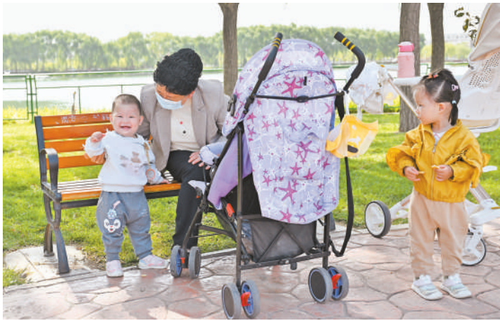
城市精细化管理不仅改变了城市面貌,更提升了市民的获得感和幸福感。