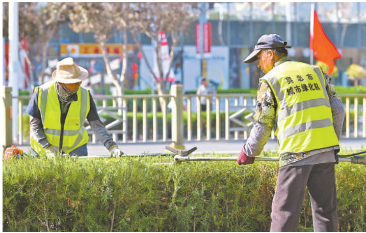
工作人员修剪绿道。