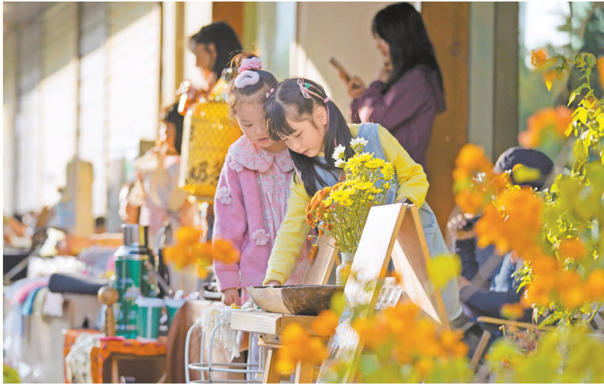
街巷独特的文化氛围,把各个年龄段的人们连接在一起。

一个充满创意与温情的市集,让银川市金凤区祥安巷散发出不一样的烟火气。近日,记者走进这条小巷,倾听它的烟火故事。故事始于今年初春。祥安巷花仓咖啡店主发现,几位熟客在享受咖啡时光时,喜欢通过手工创作交流。她们手艺精湛,所制作品常常吸引来往顾客的目光。于是,一个温暖而富有创意的想法萌发,花仓咖啡店主联合几位手工达人,在周末下午辟出店门口的小空地,为手作爱好者搭建了一个展示与出售原创作品的平台。