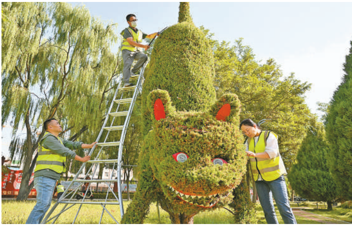
工作人员在吴忠市利通区开元大道带状公园,以“绣花”功夫雕琢绿植造型。