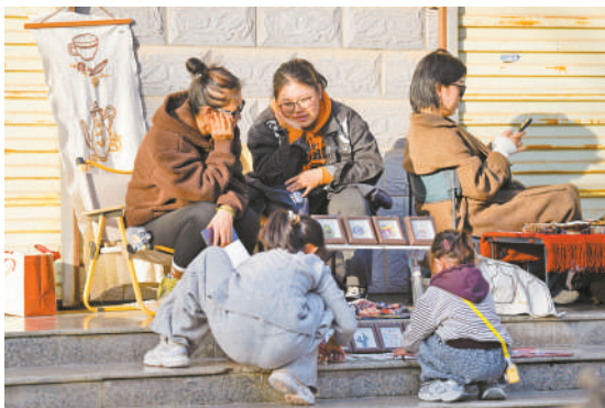
与摊主畅快交谈,聆听手作背后的故事。