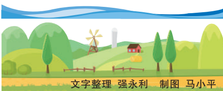
文字整理 强永利 制图 马小平

■ 脱贫攻坚成果得到巩固拓展,脱贫县农村居民人均可支配收入从2020年的11859元增加到2024年的16435元,年均增长8.5%,比全区农村居民人均可支配收入增速高0.3个百分点