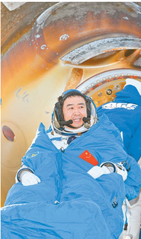
这是航天员陈冬安全顺利出舱。