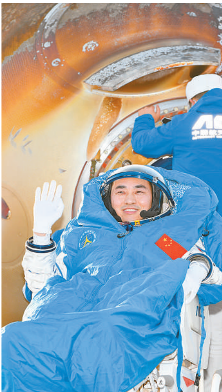
这是航天员陈中瑞安全顺利出舱。