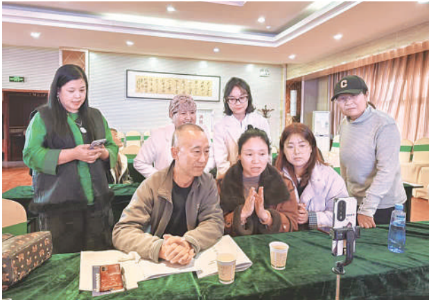
11月28日,泾源县电商学员正在直播。当日,泾源县第三期“新农人、新网红”暨电商直播技能培训班在该县举办,旨在培养更多掌握数字技能的本地人才,通过电商平台推广本地特色农产品,为乡村振兴注入新动力。

本报讯(记者 哈玲)11月28日,承载着宁夏枸杞品牌形象的4列高铁动车组从银川站出发,驶向杭州、上海、青岛等城市,标志着宁夏枸杞“高铁冠名”品牌宣传活动全面启动。 本次冠名的4列高铁动车组均为从银川站始发的热门线路,连接长三角经济圈、环渤海经济圈核心城市,沿线覆盖数亿消费人群,为宁夏枸杞搭建起面向全国的移动宣传平台。本次高铁冠名实现了“车内外全景覆盖”。车身外的品牌彩贴以鲜明的宁夏地域元素与枸杞特色为设计核心,让列车成为穿梭在祖国大地上的“宁夏枸杞移动名片”,极具视觉冲击力。车厢内部,端头壁板、座席小桌板、头枕片、车门玻璃贴、行李架等多个核心位置均设置了品牌宣传广告,从视觉上全方位“包围”乘客,形成沉浸式品牌体验。同时,车厢内的LED显示屏滚动播放宁夏枸杞品牌宣传内容,进一步强化品牌记忆点,让每一位乘客都能感受到宁夏枸杞的地道品牌魅力与实力。 “此次高铁冠名宣传是宁夏枸杞区域公用品牌推广的重要实践。通过高铁列车这一高效传播载体,不仅能让更多消费者了解宁夏枸杞的卓越品质,更能推动宁夏枸杞从区域特色产品向全国知名品牌跨越,助力宁夏枸杞产业高质量发展。下一步,我们将持续丰富品牌宣传形式,拓展销售渠道,让宁夏枸杞走进更多家庭。”宁夏枸杞协会相关负责人表示。