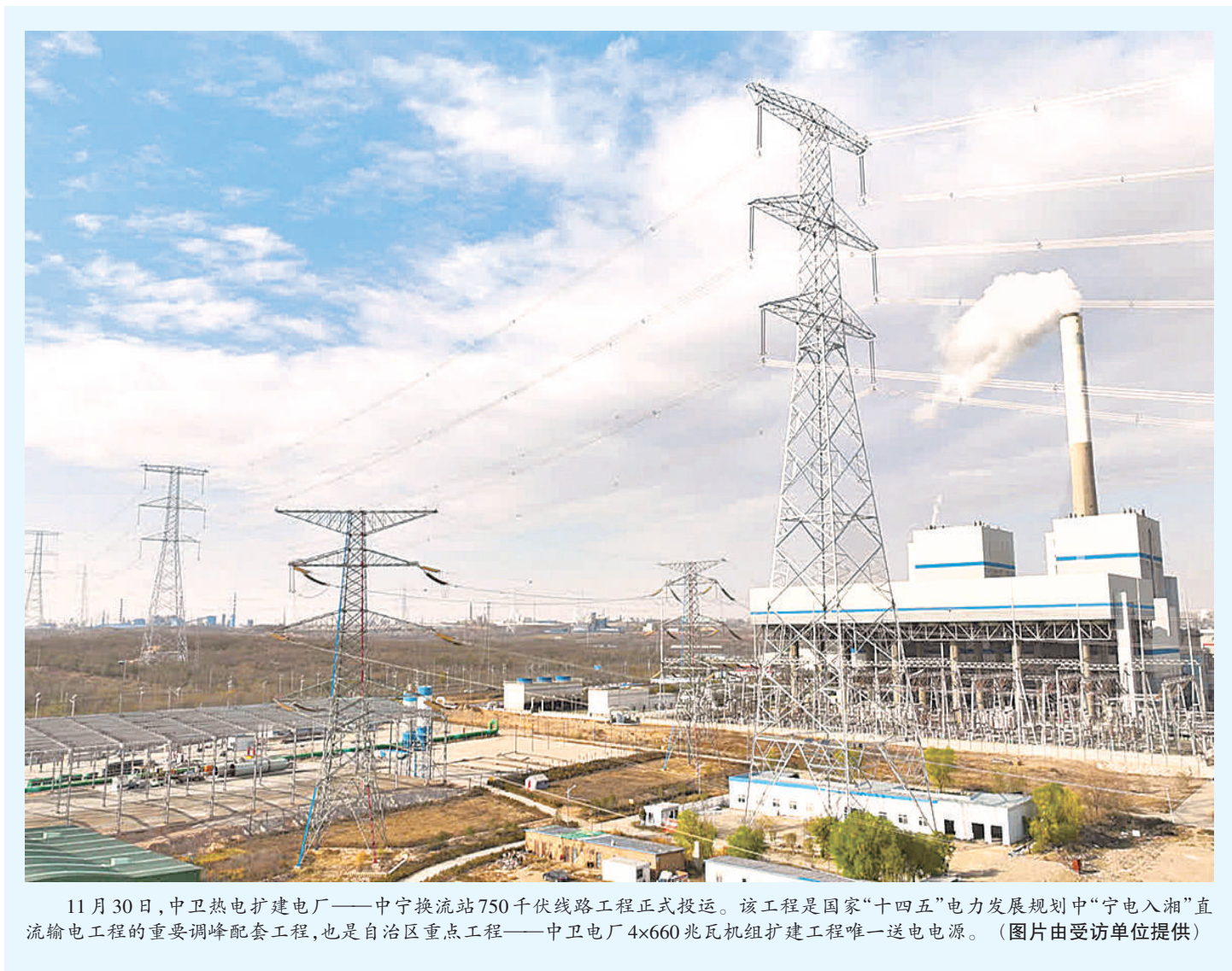
11月30日,中卫热电扩建电厂——中宁换流站750千伏线路工程正式投运。该工程是国家“十四五”电力发展规划中“宁电入湘”直流输电工程的重要调峰配套工程,也是自治区重点工程——中卫电厂4×660兆瓦机组扩建工程唯一送电电源。

研发创新和品牌建设——这些正是助推企业提质增效,构筑企业核心竞争力,促进经济质量效益型发展的关键环节。 在宁东能源化工基地,“宁质贷”还推出了升级服务。通过引入政府性融资担保机构,推出“宁质贷”专项产品,能为基地企业提供最高500万元的增信担保,降低了科技型中小企业的融资门槛和成本。这种“宁质贷+”模式的探索,正在将服务边界从单纯的贷款需求向企业全生命周期的高质量发展需求拓展。 今年以来,“宁质贷”已经为250余家企业完成授信10万余元。目前,我区正通过建立涉企行政检查“白名单”制度与全方位的金融服务,发布第二批以中小微企业为主的“白名单”,推动金融机构主动对接中小微企业,构建“信用+合规”的联动赋能机制,让更多中小微企业凭借“好质量”拿到贷款,激发市场活力,为我区经济高质量发展添砖加瓦。