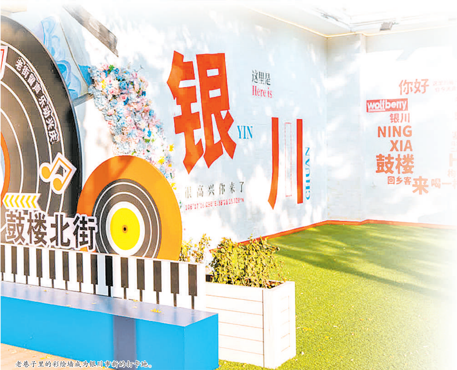
老巷子里的彩绘墙成为银川市新的打卡地。

总投资3997万元。其中,固原市原州区6个、彭阳县2个、泾源县4个。“通过建设社区食堂、增设口袋公园、完善卫生服务中心等手段,营造全龄友好的社区环境,并积极探索引入社会力量参与托育、养老,激发社区内生动力。”固原市住房和城乡建设局相关负责人说。 中卫市沙坡头区幸福里社区华西二区两个月前还是路面坑洼,如今已铺上平坦的柏油路。更让居民们欣喜的是,那些曾是老大难的旧煤房,如今变成了可以坐着拉家常的休闲回廊。中卫市在改造小区内部的同时,也对沙坡头区长城街、青山街、隆祥街、应理街及海原县柳荫路等老街道的基础设施进行全面改造提升,推动城区街道旧貌换新颜。“十四五”期间,中卫市累计投入6.5亿元,改造老旧小区217个,惠及16889户。今年,中卫市斥资1.09亿元,改造39个老旧小区,其中沙坡头区8个、中宁县31个。 从“有居”到“优居”,不仅是楼宇翻新、道路平整的硬件升级,更是居住品质、幸福生活的提升。一个个老街巷、老旧小区的改造实践,既用基础设施的硬支撑托起了生活品质,又用文化记忆的滋养留住了袅袅乡愁,成为城市发展不可或缺的温暖底色。