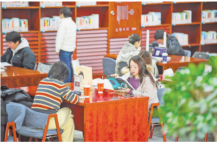
12月4日,读者在宁夏图书馆看书学习。经过为期2个多月的升级改造,宁夏图书馆于近日恢复对外开放,为广大读者带来了耳目一新的阅读体验。

的重要抓手。 为进一步扩大服务覆盖面、提升处理效率,今年10月起,银川交警进一步整合辖区11个县(市、区)大队处理平台,形成了“支队远程处理中心集中办理+基层大队分散办理”相结合的联动模式。目前,除高速公路外,该服务已经实现银川市三区两县一市全覆盖,让更多车主享受到“掌上办、马上办”的便民福利,用科技赋能为城市交通减负增效。