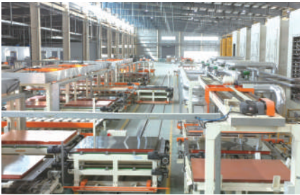
高性能金属材料产业链建成行业内规模最大、技术最先进、产品尺寸全的铝基覆铜板生产线。