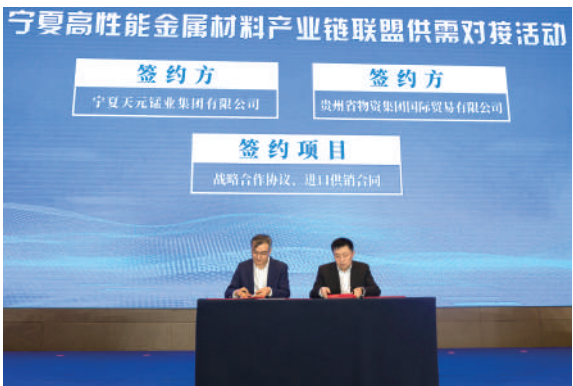
开展“千金供需对接”活动,搭建资源共享创新平台。

高端装备制造产业链。 关键核心技术实现重大突破,制造业单项冠军企业英才辈出,拥有全国首台超大型采煤输送装备、首套特大型风电轴承装备、全球最大工业级铸造砂型3D打印以及超大口径智能控制阀等高端装备产品,高档智能化数控机床产能过万台,卧式加工中心市场占有率全国第一,中型珩磨机市场占有率70%以上,智能刮板输送机成套装备享誉全球。柔性制造、AI赋能焕发智能制造全新活力,面向应用场景提供整机制造成套装备解决方案。目前,正从工业母机3D打印、大型精密铸造、高端控制阀门等通用装备,向清洁能源装备、现代农业装备、新型环保装备等专用装备产业链延伸,打造西北高端装备制造产业中心。