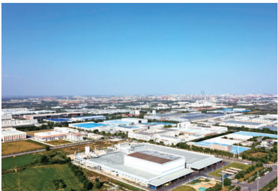
打造具有宁夏特色的优势特色产业群。

长风破浪浪潮头,链擎山河谱新篇。面向未来,宁夏工信领域将继续以“链”为基、以“群”为翼,在协同中凝聚合力,在创新中提升效能,在实干中铸就未来,努力走出一条具有宁夏特色的新型工业化之路,为加快建设美丽新宁夏,奋力谱写中国式现代化宁夏篇章砥砺前行、接续奋斗!