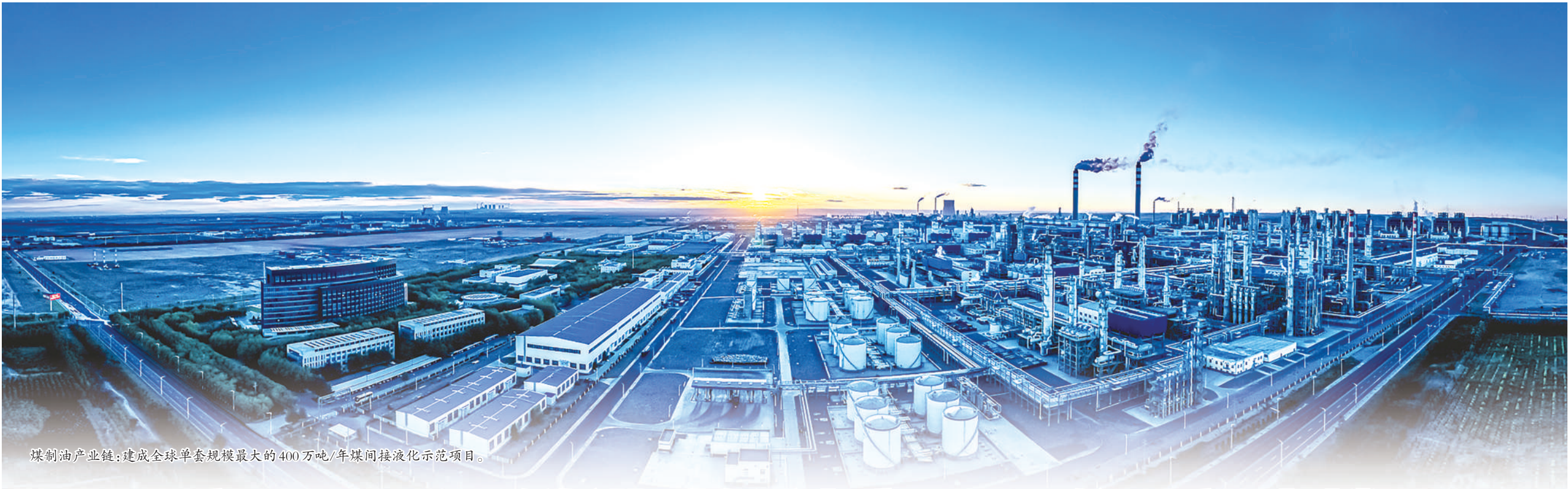
煤制油产业链:建成全球单套规模最大的400万吨/年煤间接液化示范项目。