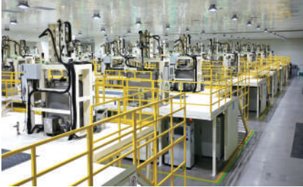
先进半导体材料产业链建成国内单体最大的工业蓝宝石生产基地。