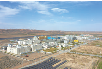
算力产业链已建成大型、超大型数据中心9个。

这里的发展实践,既深深扎根于丰厚的资源,又清醒地望向更远的前方。自治区党委十三届十一次全会擘画“突出产业集群化发展,推进链群协同,聚力打造特色优势产业集群”发展蓝图,以清晰的顶层设计为这场产业革新锚定方向。汇聚力量,各类要素正以前所未有的协同效率,汇聚于产业升级的关键环节与核心领域,推动着“链”与“群”从系统规划加速转化为发展实景,逐步构建起工业经济高质量发展的坚实底座与活力源泉。