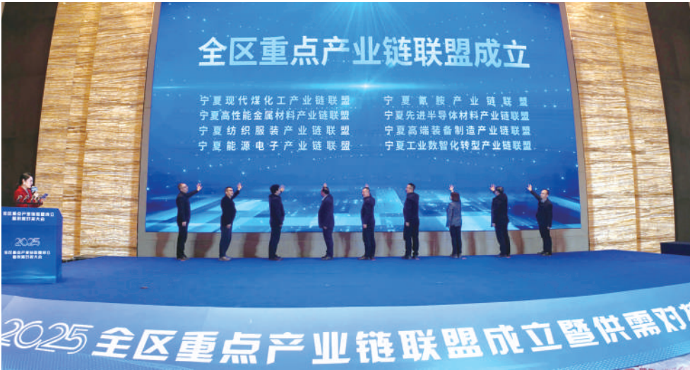
2025全区重点产业链联盟成立,超3000家企业“上链入群”。