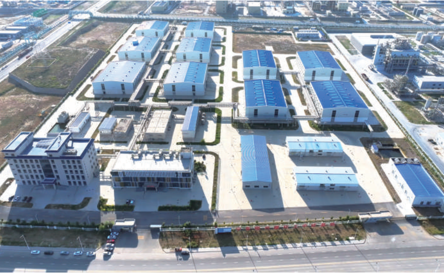
宁夏现代煤化工中试平台跻身首批国家级制造业中试平台行列。

奋斗与实绩铸就“十四五”的壮阔篇章。五载砥砺，宁夏工业以昂扬的发展激情与实干锐气，完成了一场深刻的系统重塑与能级跃迁。从传统产业的“老树新枝”到新兴赛道的“新树深根”，从创新火种的蓬勃燎原到市场主体的千帆竞发，一条以创新为引领、以实体为根基、以特色为优势的高质量发展之路清晰呈现，坚成定型。这不仅是对时代考题的有力作答，更是面向未来新征程的豪迈奠基。一幅更具韧性、活力与竞争力的现代化工业宏图已全面擘画，一艘承载着光荣与梦想的工业巨轮，正从这片充满希望的热土再次鸣笛启航，向着中国式现代化的壮丽前景，乘风破浪，一往无前！