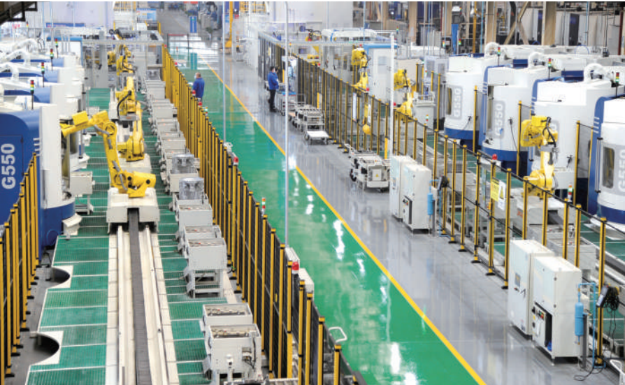
巨能机器人数字化车间。2025年，该公司荣获中国机器人行业专业奖项——“伺服克”年度卓越应用场景奖。