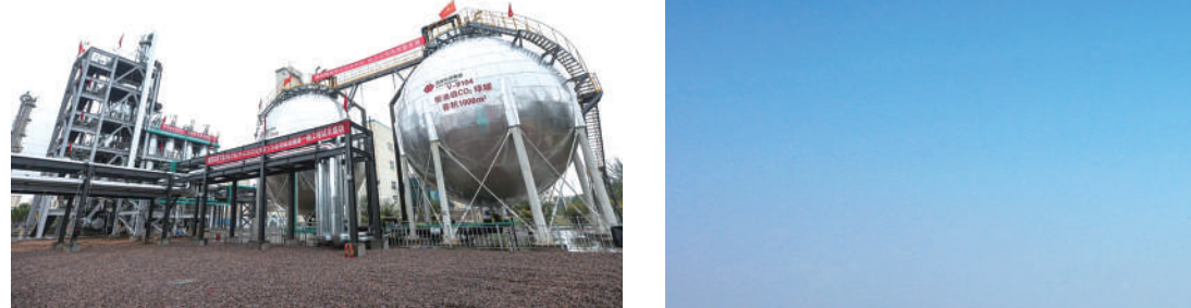
宁夏300万吨/年CCUS项目成为绿色低碳全流程规模化示范项目。

循环利用体系成型，畅通资源代谢“静脉”。 宁夏着力构建“资源—产品—再生资源”的闭环循环，让传