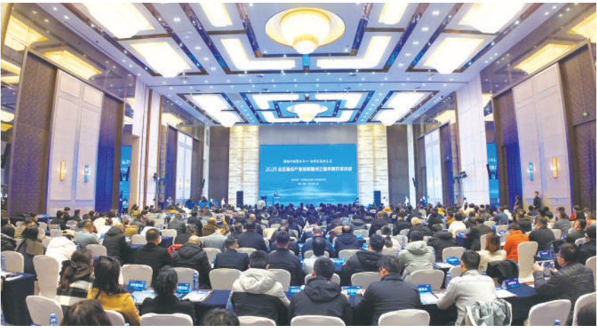
宁夏成立工业领域八大产业链联盟，带动上下游企业智能化、绿色化、融合化发展。