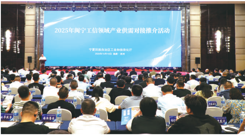
阅宁工信领域产业供需对接破解企业“市场找不到、供应链不通畅”等现实难题。