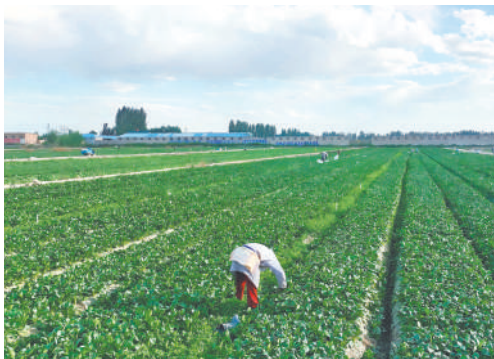
永宁供外蔬菜集中连片,形成特色产业集群。