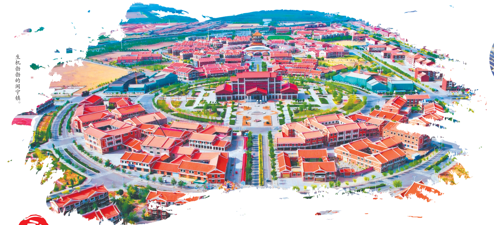
生机勃勃的闽宁镇。