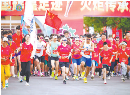
农文旅体融合发展集聚人气。