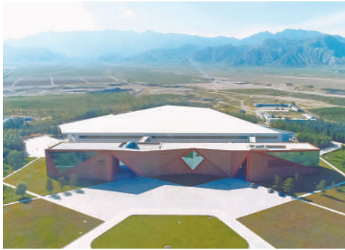
长城中粮天赋酒庄完成首笔葡萄园碳普惠交易。