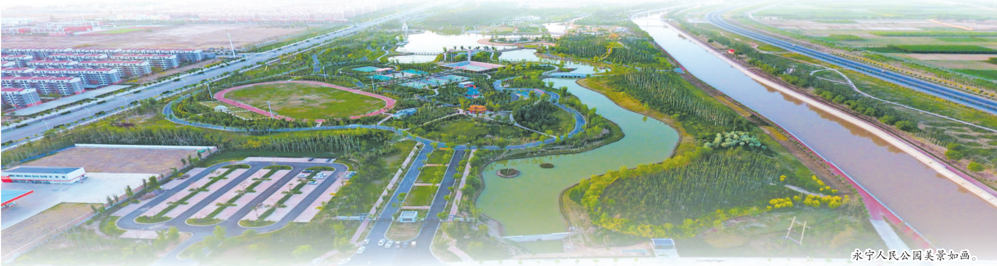
永宁人民公园美景如画。

实现教育、医疗等领域及6村1社区结对帮扶全覆盖。闽宁镇零工市场、劳务协作基地揭牌运营,带动移民群众就业5500人,增收8300余万元。闽宁协作高质量发展招商推介会签约投资22.72亿元,“宁品出塞、闽品西行”等活动深入开展,孵化“塞北滩”“山海有你”等电商团队,“闽宁故事茶文化”跻身“宁选好礼”,实现消费帮扶5.4亿元。