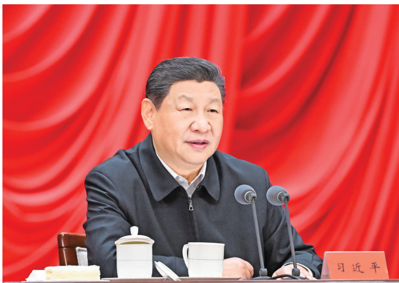
1月20日,省部级主要领导干部学习贯彻党的二十届四中全会精神专题研讨班在中央党校(国家行政学院)开班。中共中央总书记、国家主席、中央军委主席习近平在开班式上发表重要讲话。

高昆曾被先天性疾病困住脚步,为生计辗转发愁。如今的他,在包装车间里忙得热火朝天。每月按时发放的工资与