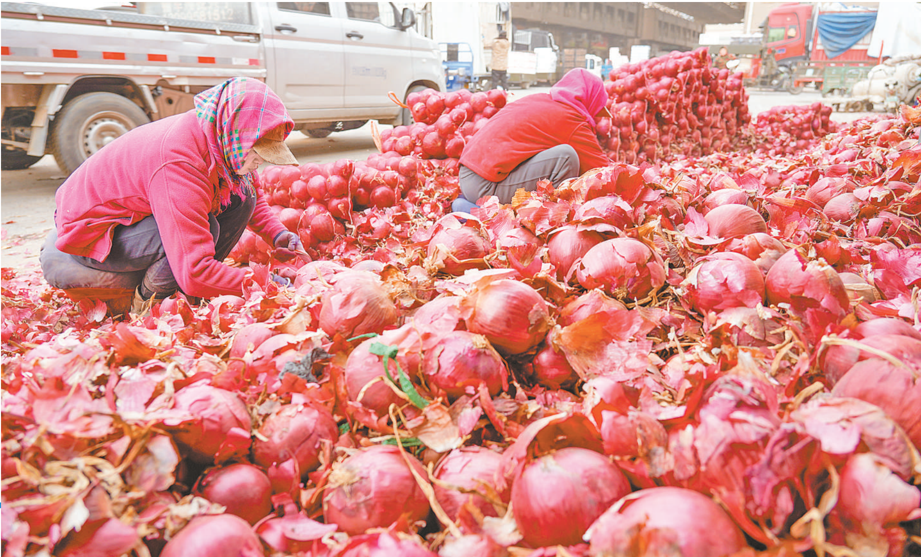
工作人员对洋葱进行分拣、打包。