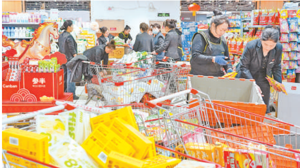
超市工作人员加紧上架新品。