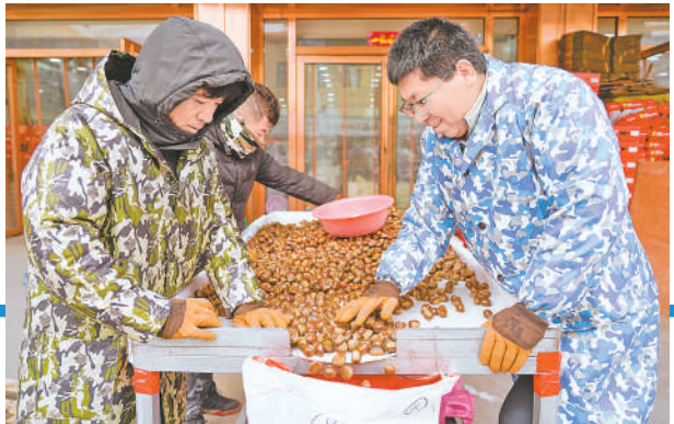
干果区工作人员对栗子进行分拣。