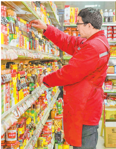
调味品销售区的货架上,各种调味料摆得满满当当。