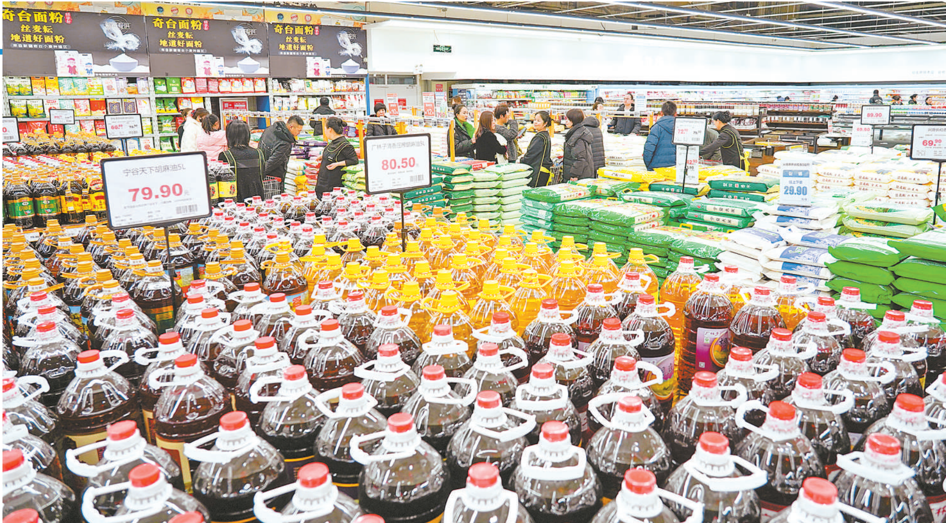
米面粮油等商品充足。