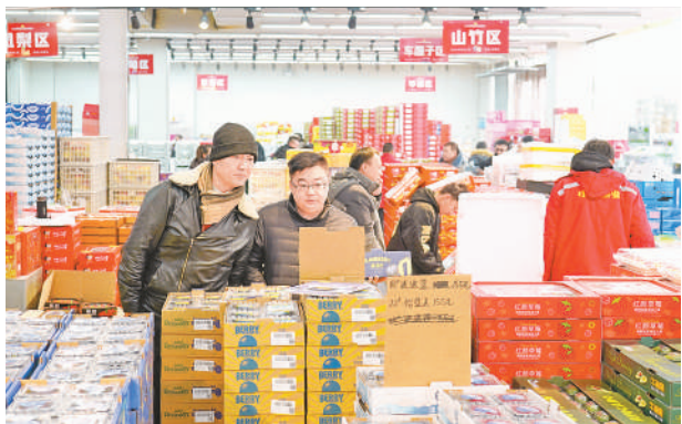
精品鲜果区有芒果、蓝莓、车厘子等水果。