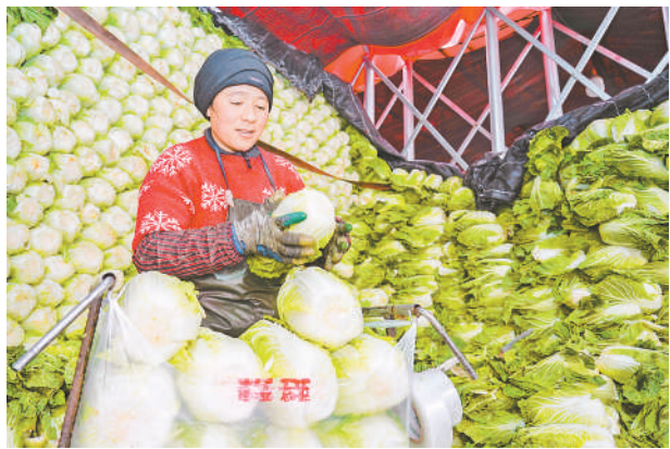
工作人员对白菜进行去根、打包。