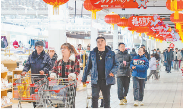
临近春节,超市里洋溢着浓浓的节日氛围。