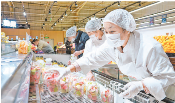
超市工作人员佩戴口罩和手套,严格做好卫生防护,将新鲜切配的水果上架。