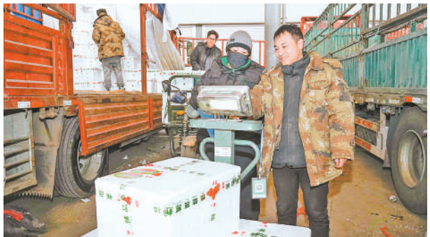
西红柿交易区,分销商与批发商进行称重并商议价格。