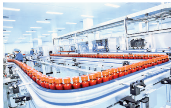
百瑞源枸杞股份有限公司凭借以顾客为核心的枸杞全产业链质量管理模式，荣获中国质量奖提名奖。