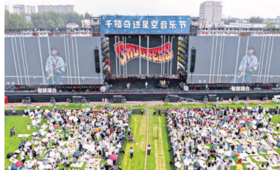
2025千禧奇迹星空音乐节现场。

展望2026年，贺兰县紧紧围绕“双示范县”和“四区”建设目标，全面实施“八强八新”工程，确保实现“十五五”良好开局，为加快建设美丽新宁夏、奋力谱写中国式现代化宁夏篇章作出新的更大贡献。