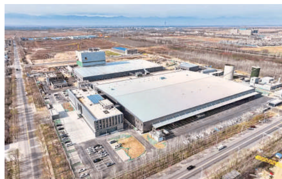
原源(宁夏)新质乳品精加工项目一期投产达效。