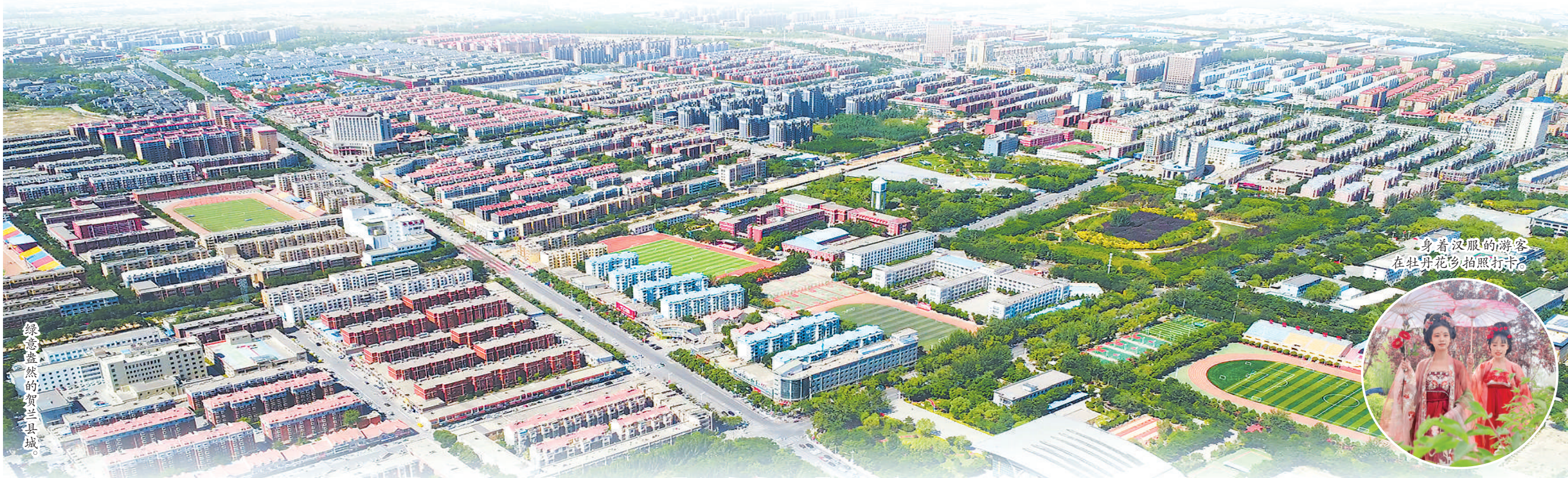
绿意盎然的贺兰县城。