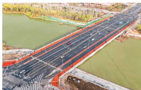
天平桥通车进一步拉近贺兰县与银川市主城区的距离。