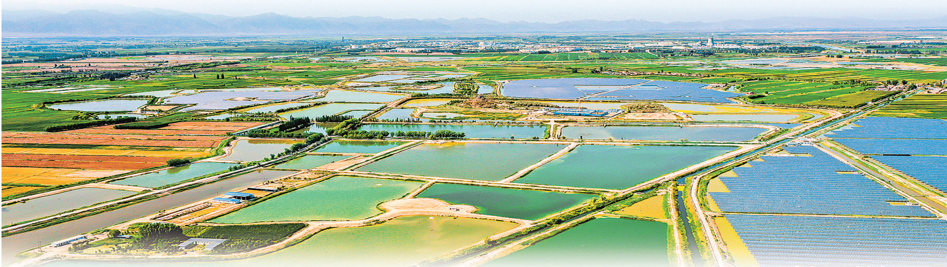
贺兰山下七彩大地。

社会保障网越织越密。2025年，贺兰县基本养老和医疗保险参保率均达95%以上，47家基层养老服务机构惠及4.86万老年人，托育服务供给更加充分。发放社会救助资金8636.46万元，惠及1.9万人，困难群众的生活更有底气、更有质感、更有尊严。