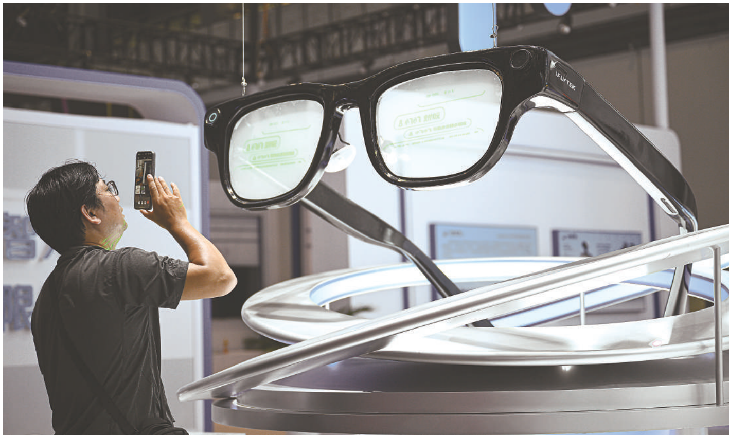
↑ 4月10日在第六届消博会主会场拍摄的AI眼镜模型。