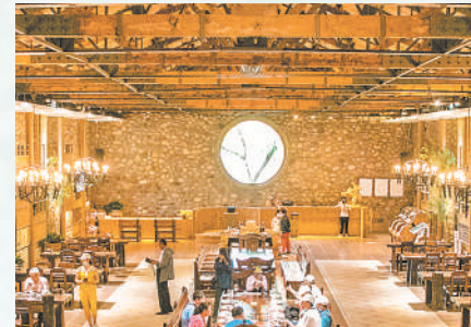
贺兰山东麓酒旅融合正芬芳。