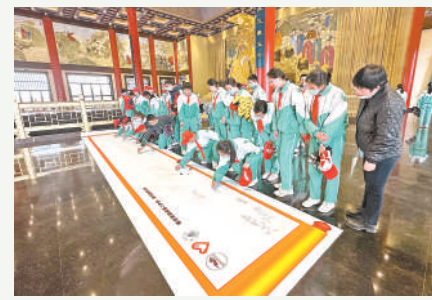
学生参加研学旅游。

塞上山川,春去春来皆为景;东西南北,东进西出有故人。从闽宁镇到览山公园,从66号公路到火山寨,宁夏的春天处处是风物,步步有惊喜。