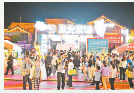
银川文化城夜游项目。