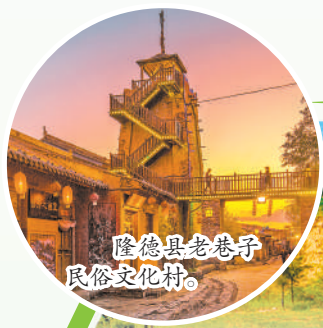
隆德县老巷子民俗文化村。