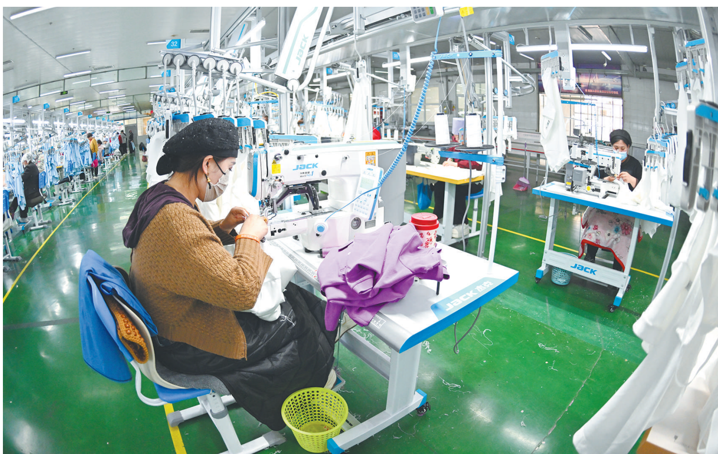
当地群众熟练地操作着生产线上的各种机器。