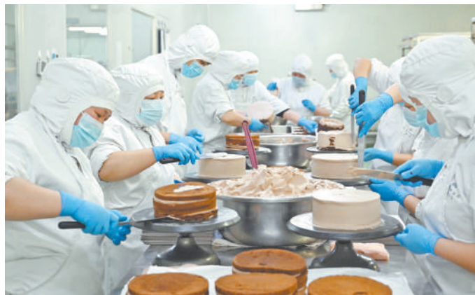
蛋糕师精心制作蛋糕。