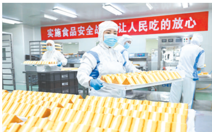
蛋糕生产车间,严控食品安全。