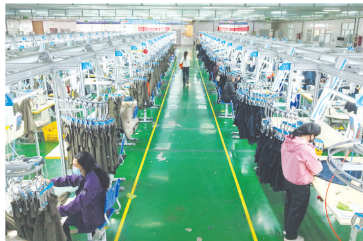
宽敞明亮的生产车间。