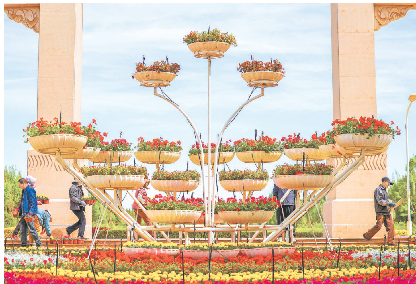
4月28日,园林工人在摆放花卉。今年“五一”国际劳动节期间,银川市计划展摆十余个品种花卉近30万盆,提升城市景观品质。

“按照计划,我们将依托政策引导,持续规范危废收集、贮存、利用、处置全链条监管,也希望各类市场主体理性判断当前危险废物利用处置市场形势,科学开展投资决策,有效防范投资风险。”银川市生态环境局负责人介绍,待国家和自治区“十五五”相关政策出台后,同步衔接落实最新管控要求。