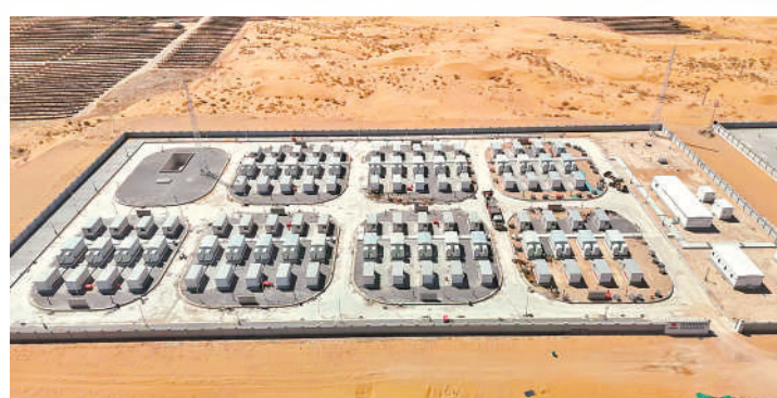
新能源项目建设加速推进。

暮春时节的中卫市沙坡头区，田野里机声与笑语交织，工地上焊花与汗水辉映，校园中书声与笑脸相伴——一幅幅干劲十足的画卷正在这片热土上生动铺展。从一粒种子到万亩良田，从一间病房到万家灯火，沙坡头区以实干为笔、担当为墨，在各领域齐头并进，写下一份厚重而温暖的高质量发展答卷。科技深耕沃土，项目拔节生长，消费活力涌动，教育更有温度，医疗更有质量，每一项务实举措都回应着群众期盼，每一组数字都传递出奋进强音。