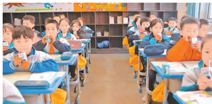
沙坡头区为农村学生免费发放牛奶。