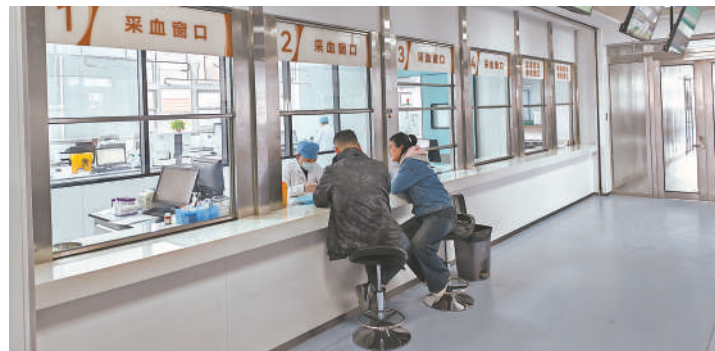
舒适的就医环境让患者做检查不再拥挤。