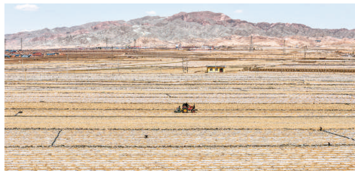
瓜农为砒砂瓜覆膜保墒。