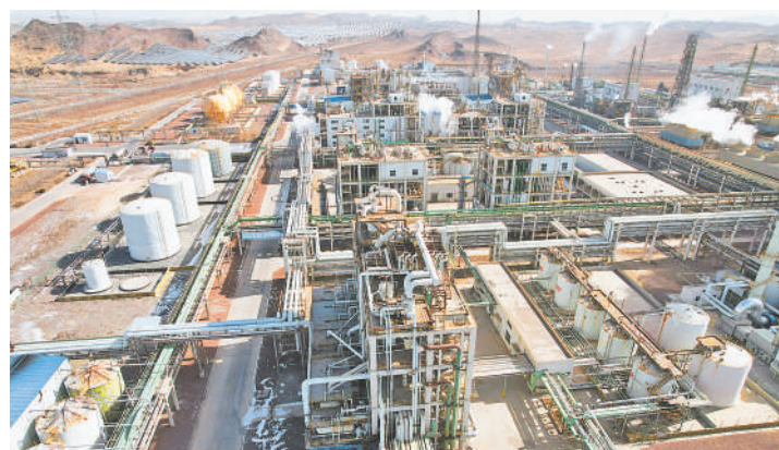
宁夏紫光天化蛋氨酸有限责任公司。