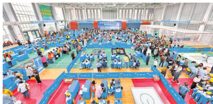
沙坡头区举办科技创新大赛，吸引4000余名师生参加。