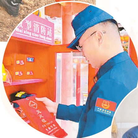
→石嘴山市大武口区消防救援大队、隆湖消防救援站的消防员在辖区星海镇六站东村入户走访。