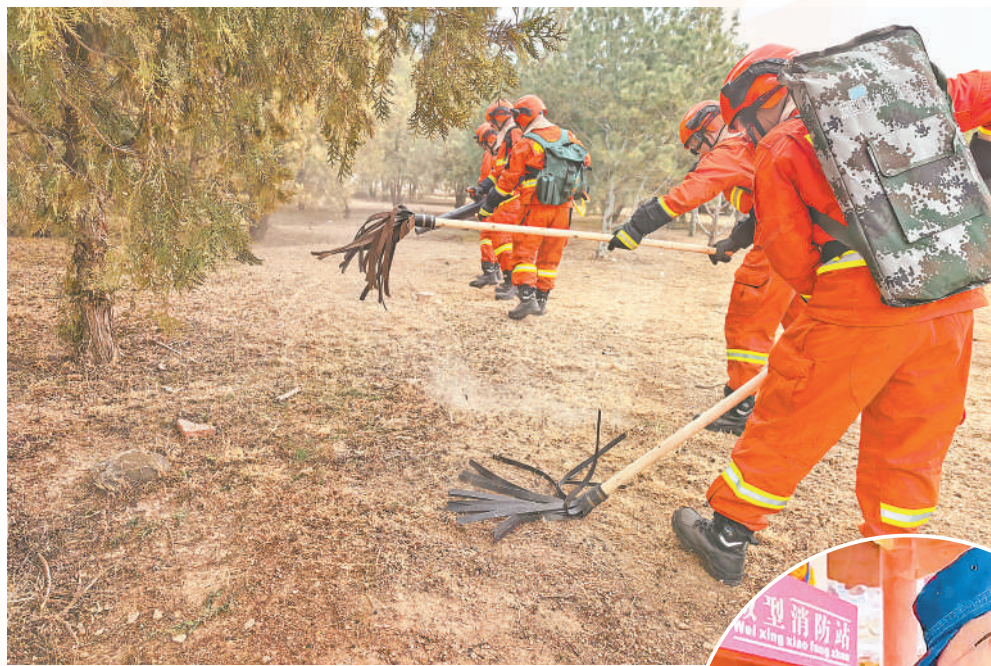
银川消防救援机动大队进山开展防火宣传、巡查及指导。