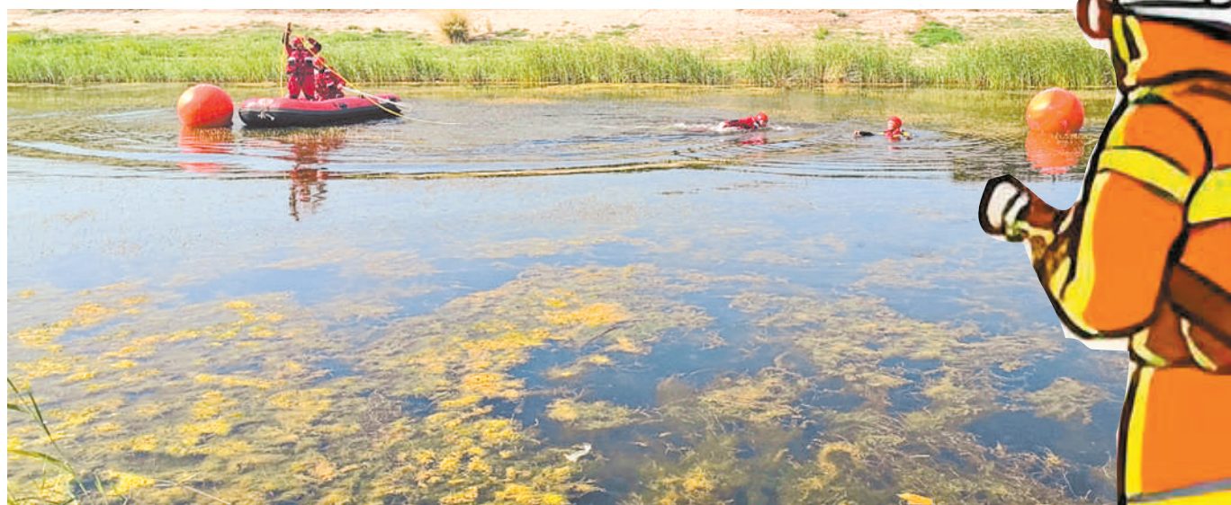
永宁县消防救援大队望银路消防救援站的消防员正在开展水域救援训练。