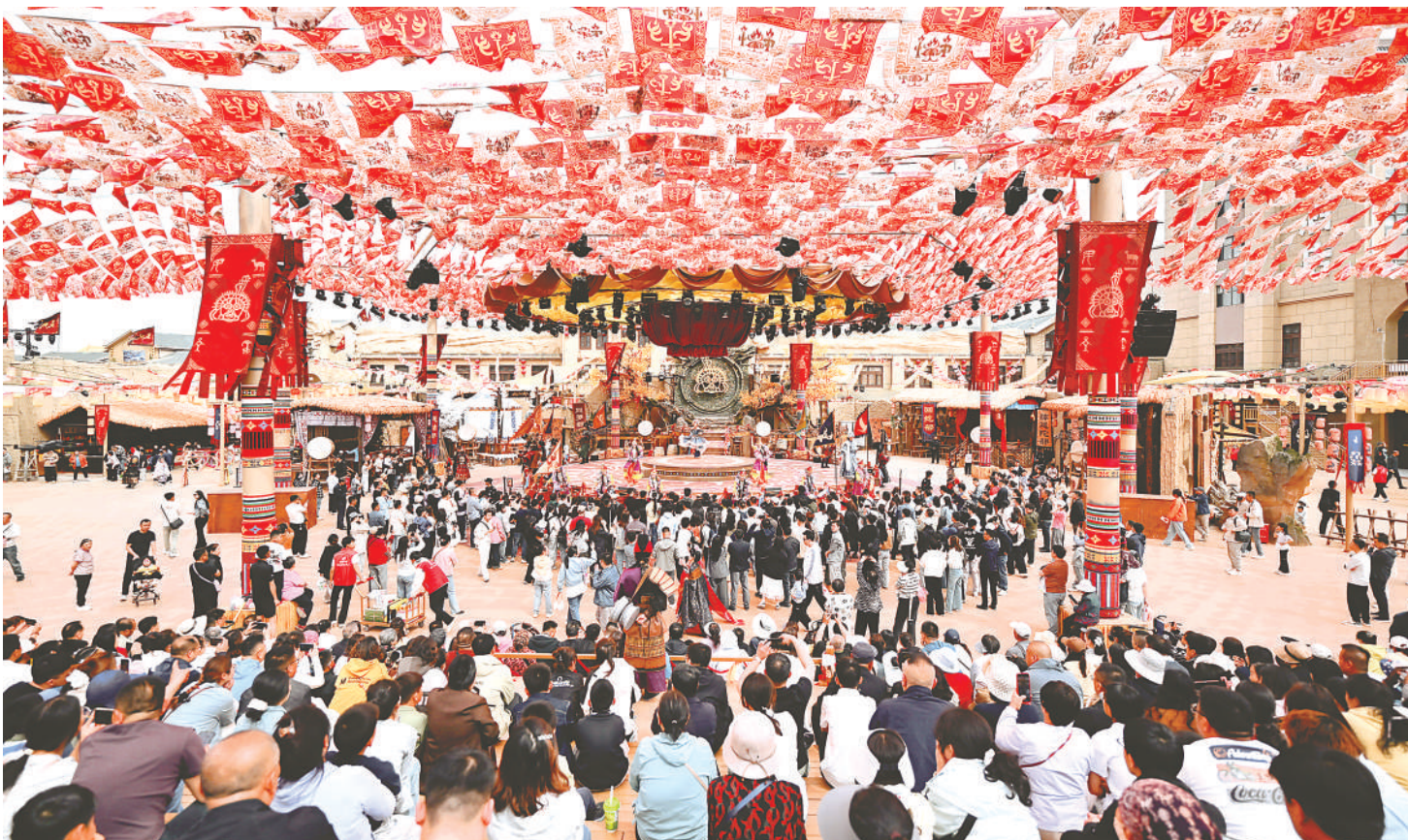
5月1日,漫葡·看见贺兰沉浸式演艺小镇3.0版本正式开园,为游客带来全新沉浸式体验。“五一”假期,宁夏文旅以210项特色活动为支撑,聚焦文旅融合创新,为游客打造高品质出游体验。

本报讯(记者 徐琳)多彩活动轮番上演,商圈市集热闹红火,景区体验迭代升级……“五一”假期,宁夏以丰富的文旅商活动、贴心的惠民政策、多元的消费新场景,持续激发市场活力。