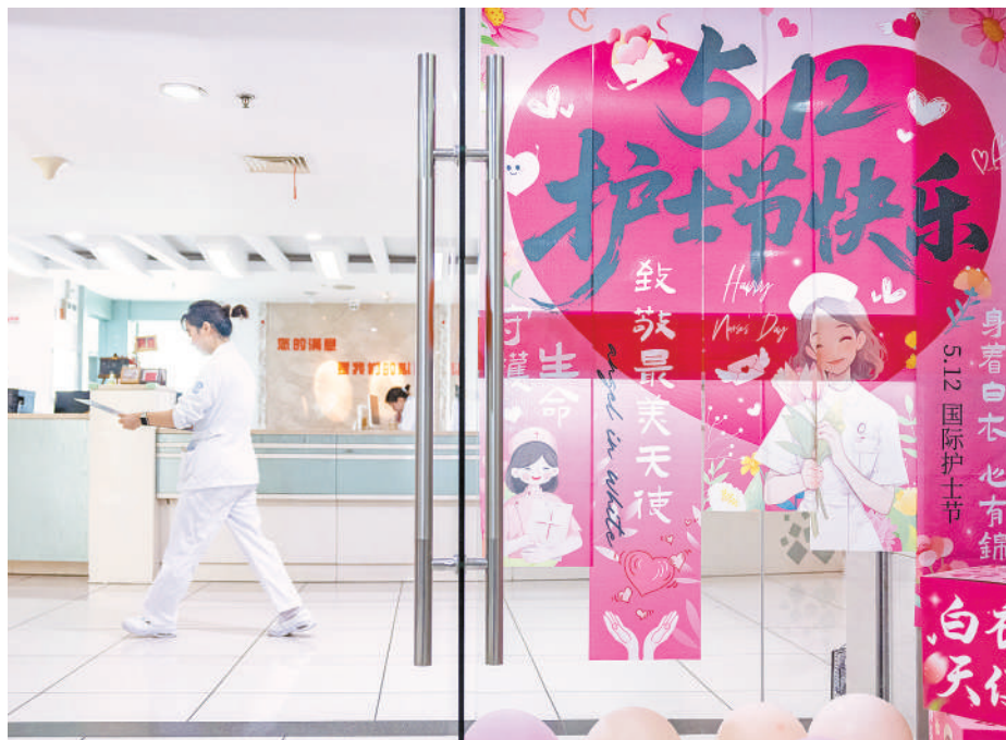
5月12日,一名护士在浙江省湖州市妇幼保健院住院部忙碌。5月12日是国际护士节,白衣天使忙碌在岗位上,用实际行动诠释护士的职业精神和责任。

据统计,我国二级及以上医院中,急诊科、ICU、手术室等急难险重岗位的护士占比超三成。他们常年处于高强度、高压、高风险的“三高”工作状态,却始终坚守着生命的防线。