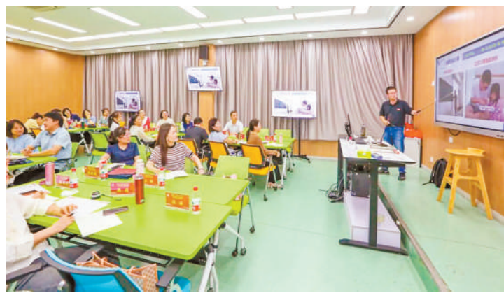
福州大学对口支援银川能源学院青年骨干教师专业素质与能力提升项目培训班(工科学院)课堂。(资料图片)