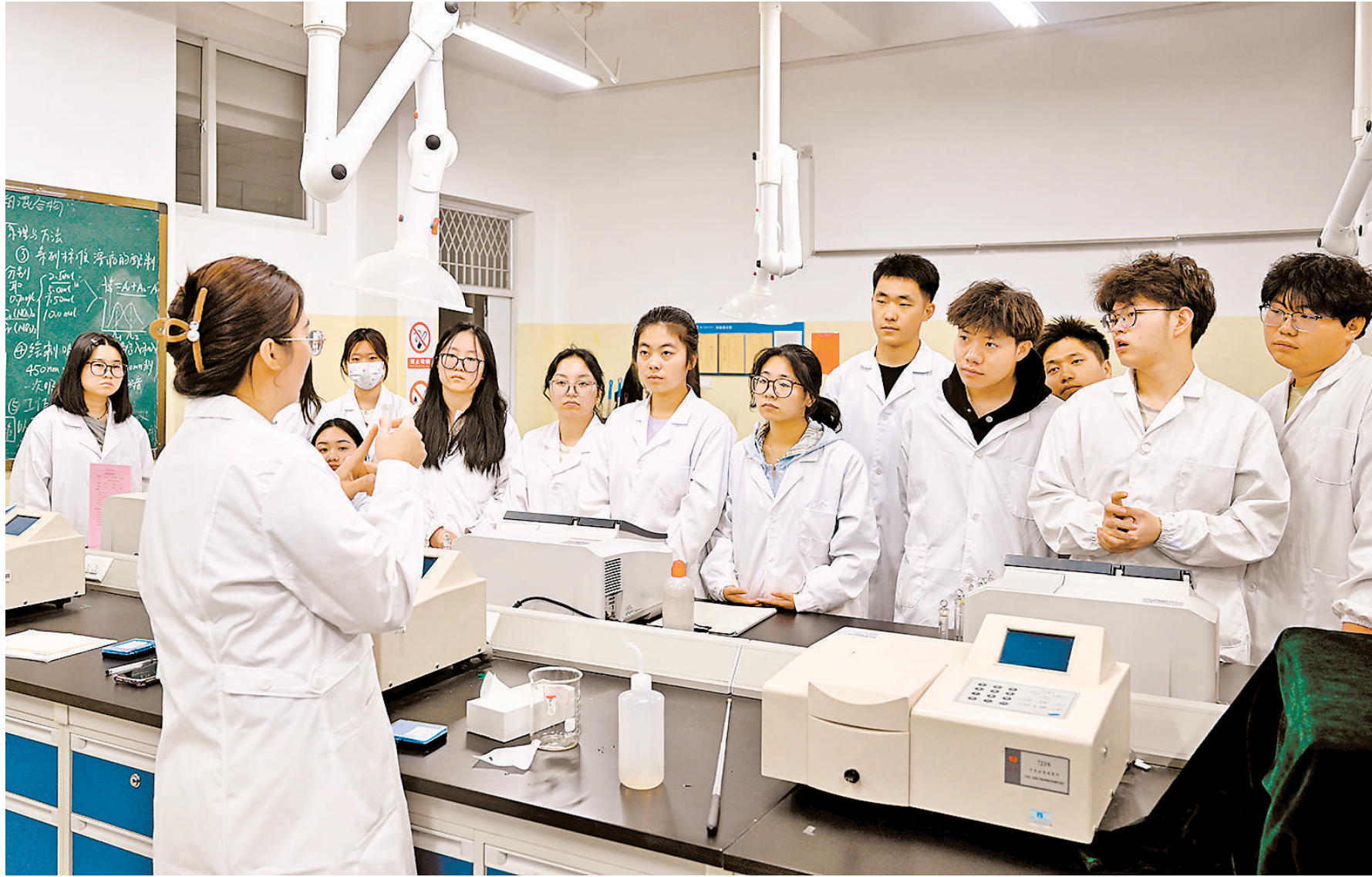
化工学院教学课堂。