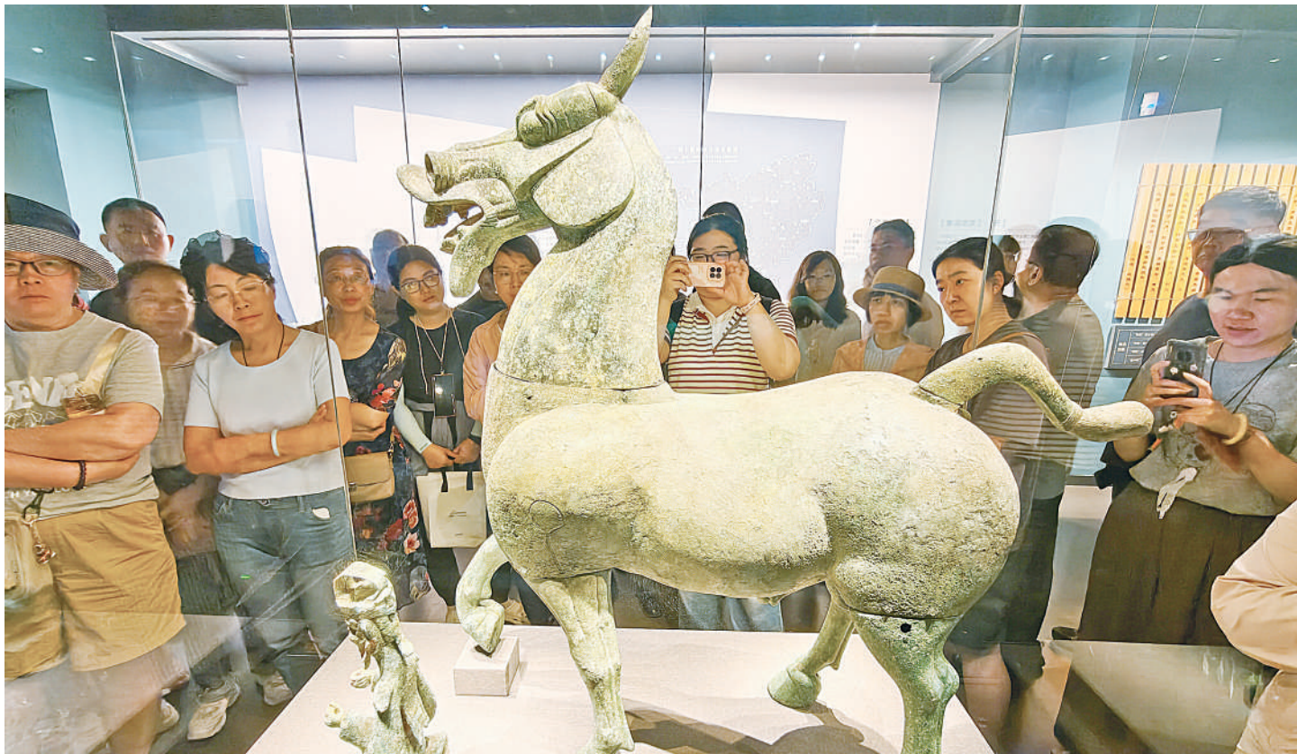
5月16日,观众在位于南宁的广西博物馆观看“西汉铜牛”。2026年国际博物馆日即将到来,各地迎来博物馆参观游览热潮。