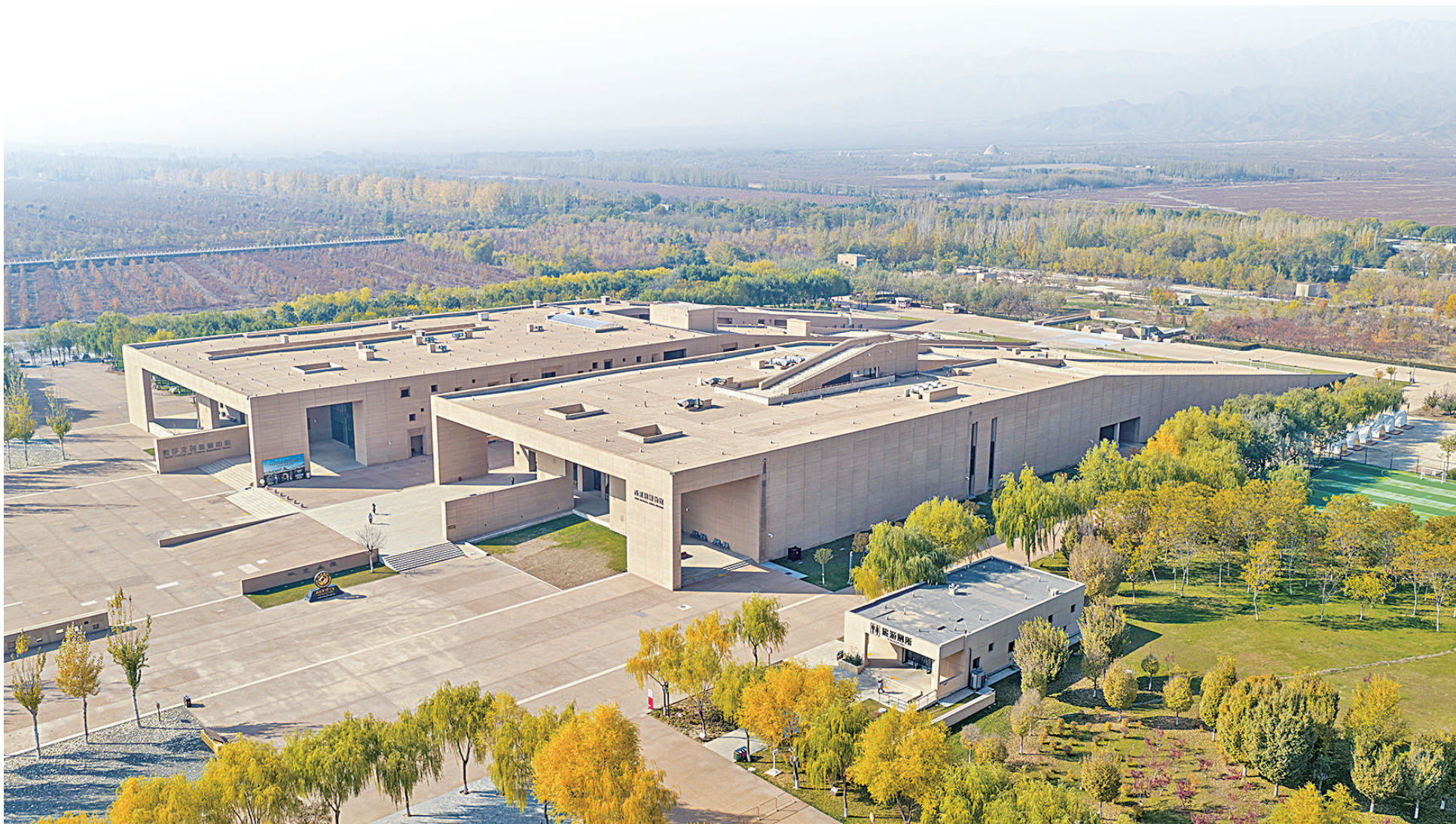
西夏陵博物馆建筑遵循“消隐和起伏”的设计理念,仿佛从土地中自然生长出来。