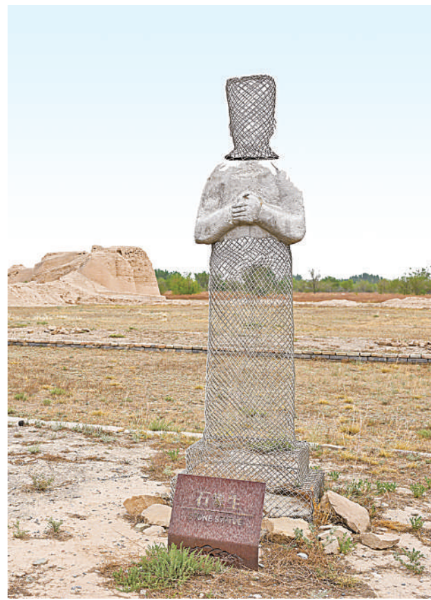
西夏陵遗产区内的特色景观建筑“石象生”。