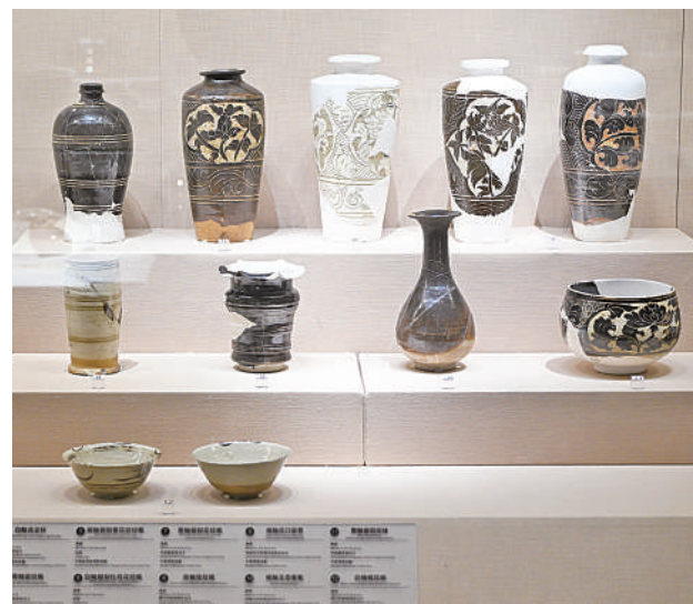
在宁夏博物馆展陈中有意保留文物修复的斑驳痕迹,向公众传递“真实性保护”的理念。