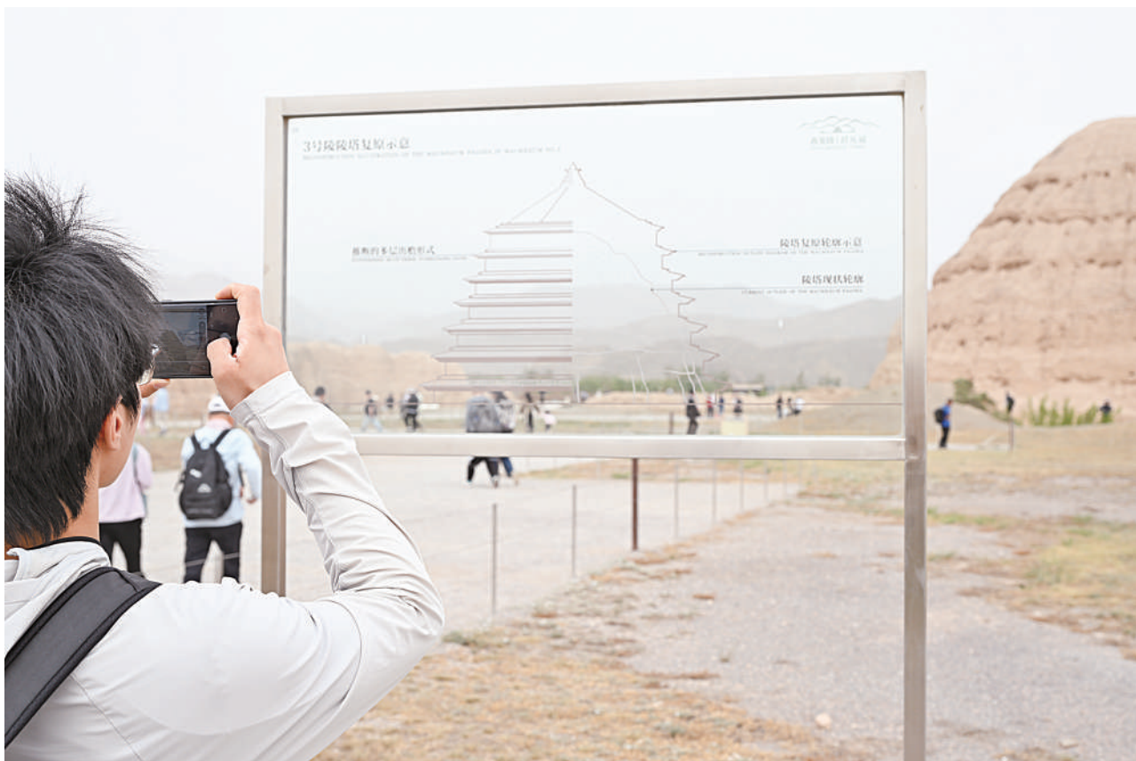
西夏陵遗产区,游客透过景区设置的示意图拍摄留念。