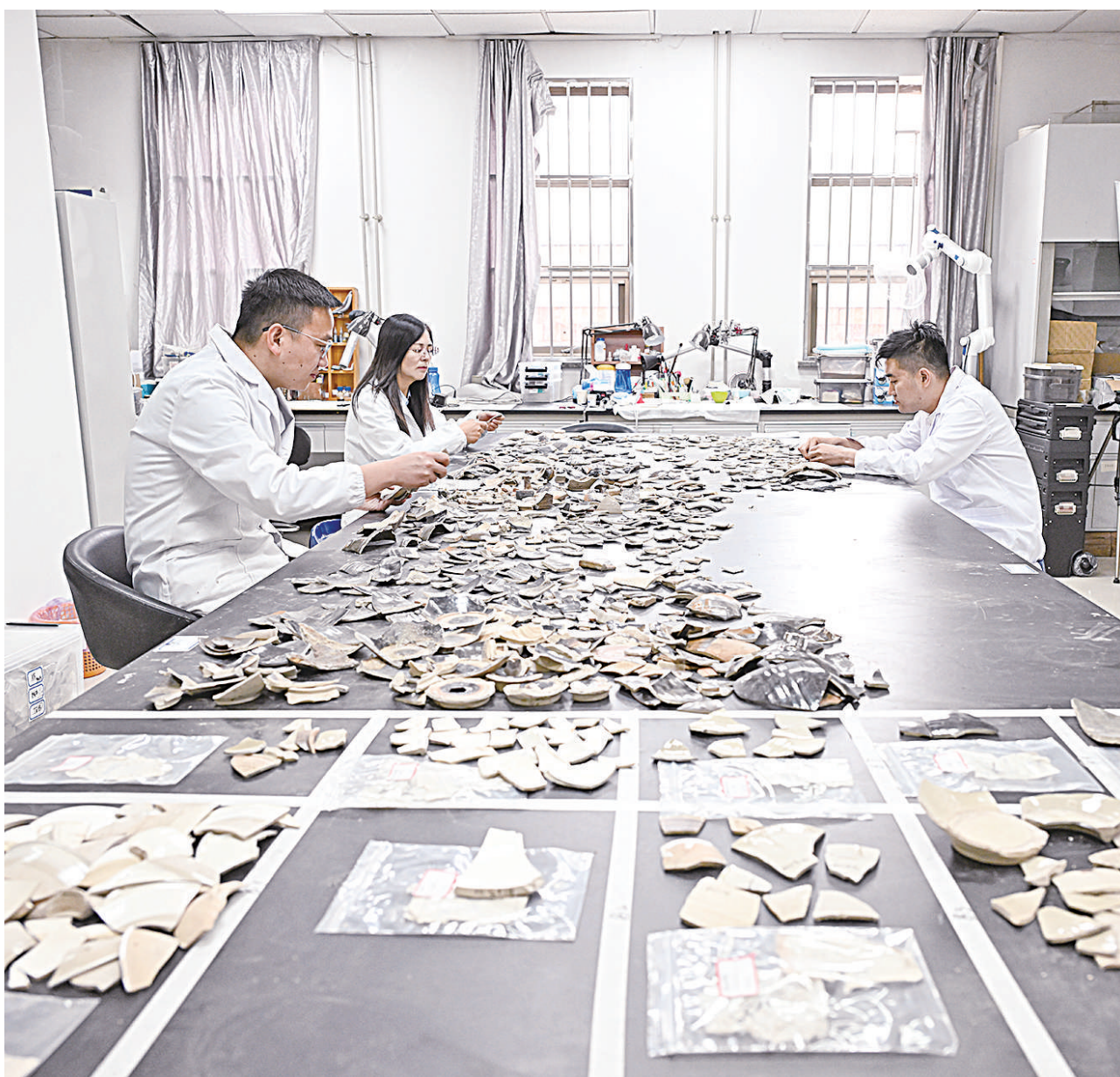
宁夏博物馆,文物修复师正与时间“对话”。