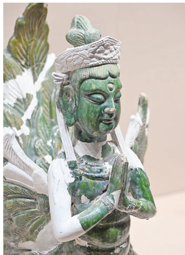
宁夏博物馆内展示的修复展品绿釉迦陵频伽。