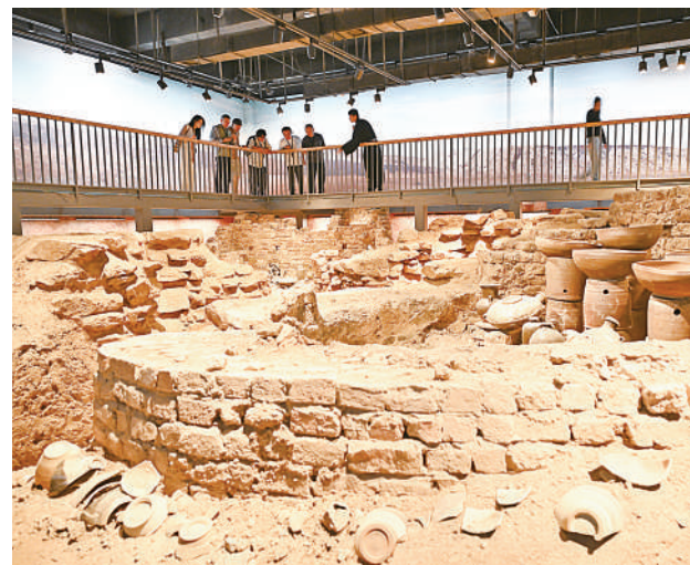
游客在西夏陵博物馆内参观。