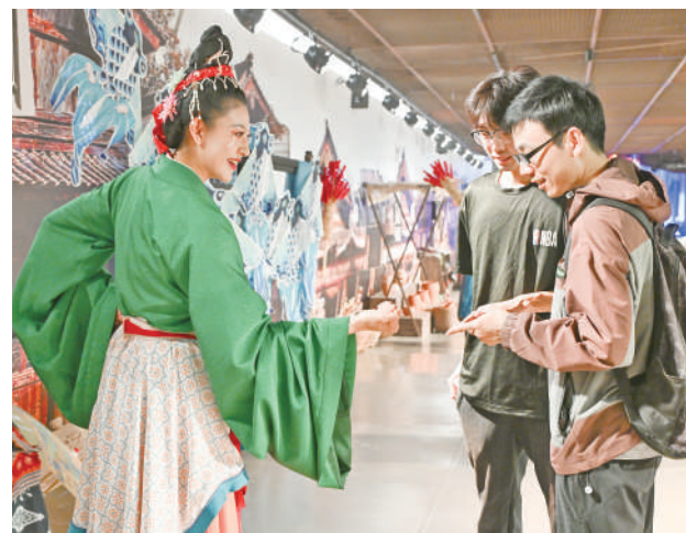
西夏陵景区,演员在廊街上与游客互动。