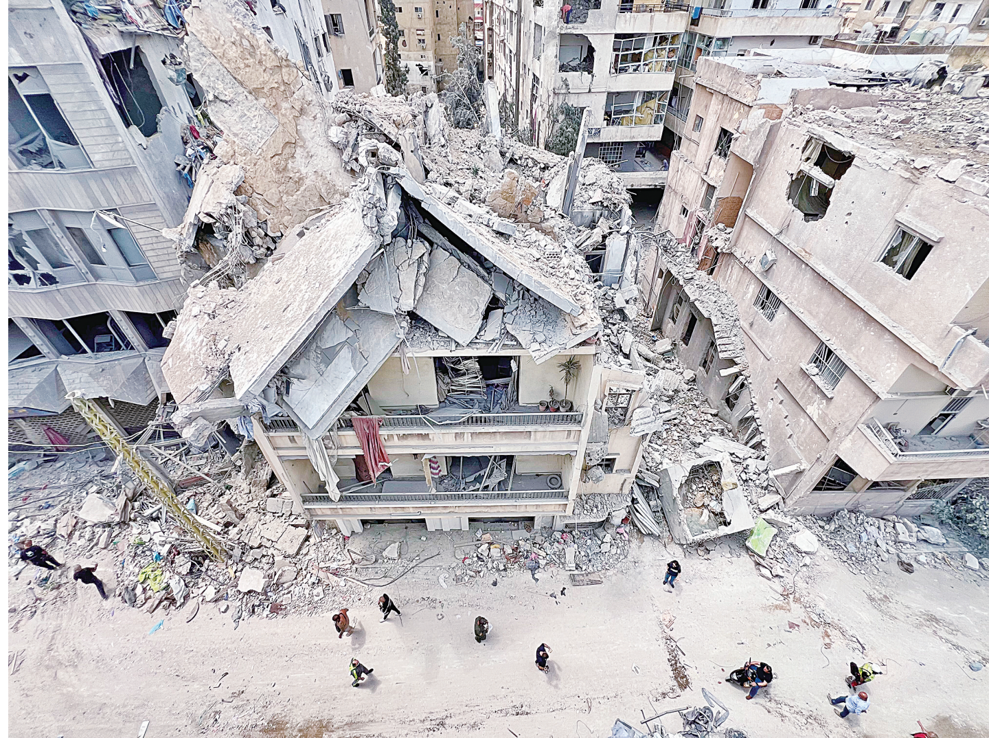
这是5月16日在黎巴嫩南部提尔拍摄的遭以军空袭损毁的建筑(手机照片)。黎巴嫩代表团5月15日发表声明说,黎巴嫩、美国和以色列三方在华盛顿举行的两天会谈取得“对黎方有利的外交进展”,各方同意将停火期限再延长45天。同一天,以军空袭包括提尔地区在内的黎南部多地,造成至少12人死亡。

由法国与肯尼亚共同主办的“非洲前进”峰会日前在肯尼亚首都内罗毕落下帷幕。在传统军事存在和政治影响力收缩背景下,法国试图淡化其殖民历史,营造“新一代伙伴关系”形象。法国总统马克龙在峰会上一些言行引发争论,对法国能否与非洲国家建立真正平等的伙伴关系,非洲舆论提出质疑。 摆脱标签 重塑叙事 法国总统府表示,这是首次由法国与非洲法语国家共同主办此类峰会,旨在促进经济交流和投资,并加强法非双方协调,共同应对全球重大挑战。 过去,法国对非影响力重心集中在非洲中西部的法语国家。近年来,法国在多个法语国家的驻军因干涉内政等原因引发当地民众不满,以撤军收场,在非整体影响力不断衰退。 肯尼亚政治分析人士贝弗莉·奥坎认为,法国在西非地区不断受挫,因此试图将对非战略重点向非洲大陆东部转移。 肯尼亚具有英语国家、东非门户、地区金融中心、区域外交平台等多重属性,正好符合法国从传统政治安全影响力转向经济金融影响力的需要。 据法国总统府介绍,峰会将为企业、民间社会、侨民和青年等议题共同置于中心位置。这延续了2021年在法国南部城市蒙彼利埃举行的法非峰会的思路,用“社会化”“青年