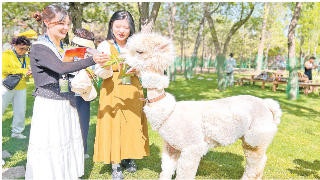
5月18日,“乐享品质游灵武·共赴山河新旅程”2026年灵武市全域旅游系列活动在奥体园启幕。图为游客与羊驼互动。

“公约定好了、用活了,能聚民心、淳民风。”海原县委社会工作部负责人说,该县还推行了党组织统筹、群众参与、村务监督委员会常态化监督的落实机制,切实让村规民约惠及群众。