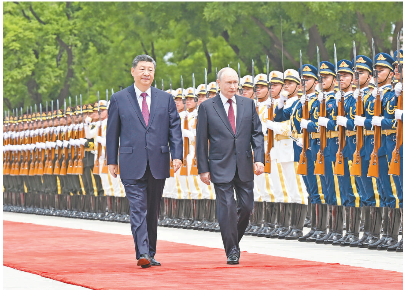
5月20日上午，国家主席习近平在北京人民大会堂同来华进行国事访问的俄罗斯总统普京举行会谈。